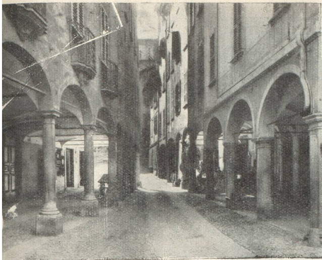
Rue du vieux Lugano