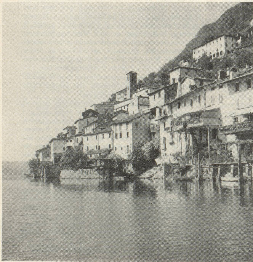
Gandria au bord du lac de Lugano

Maisonnettes roses et blanches villas, châlets, fontaines, terrasses, ruisseaux. Les autochtones parlent trois langues et font des discours en patois et les étrangers ont la bouche toute ronde à force de dire « C'est magnifique ! » Il ne faut pas oublier le château de Locarno avec ses murailles de gros blocs et ses