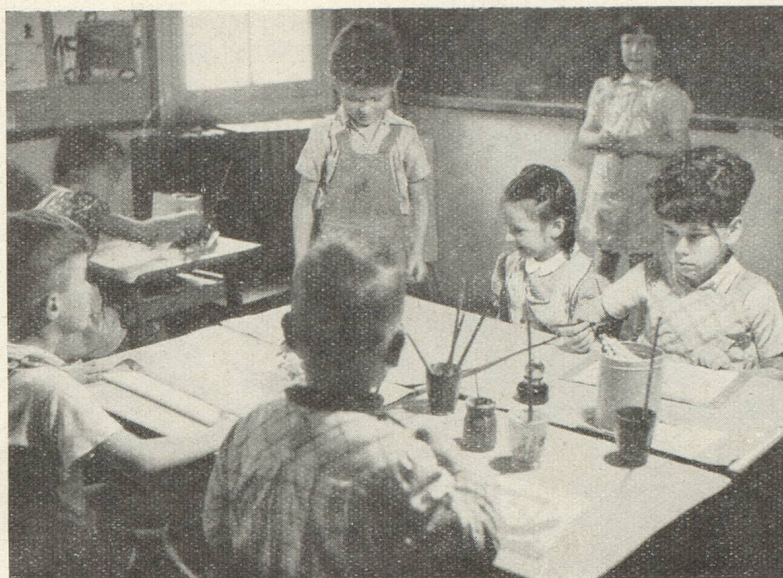
Le dessin, merveilleux moyen d'expression