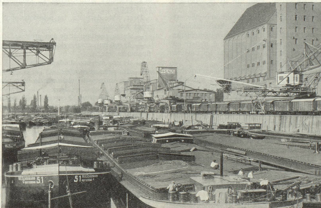
Le port de Bâle sur le Rhin, principale porte d'entrée des importations de la Suisse