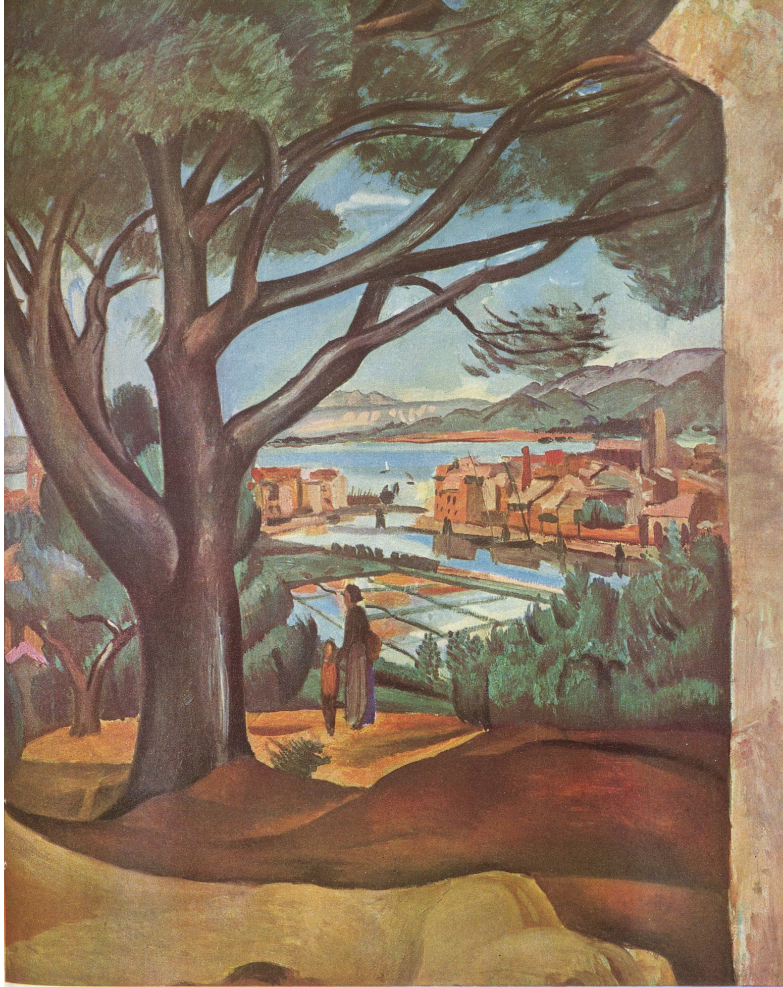
ANDRÉ DERRAIN : Les Salines de Martigues (1912-1913) Berna, collection particulière