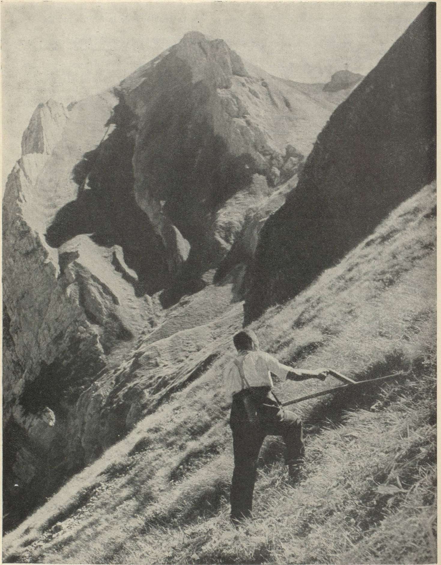
Paysan fauchant son herbe dans l'Oberland bernois