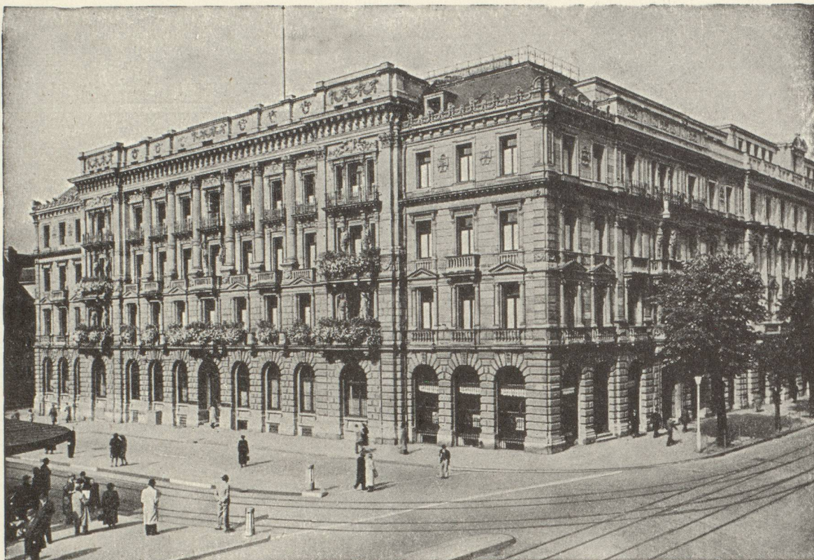
Hôtel de la Banque à Zurich