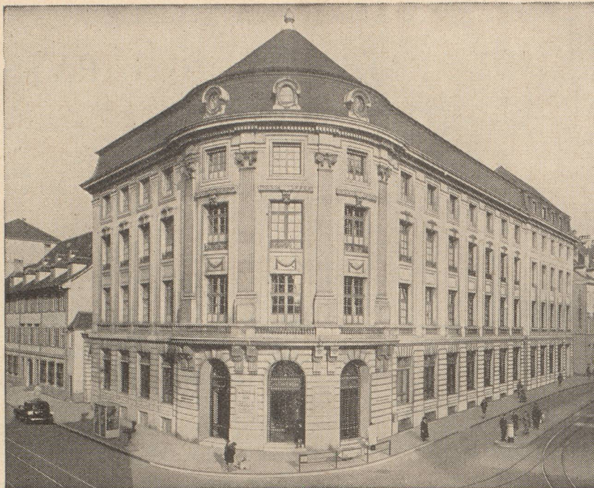
HOTEL DE LA BANQUE A BALE