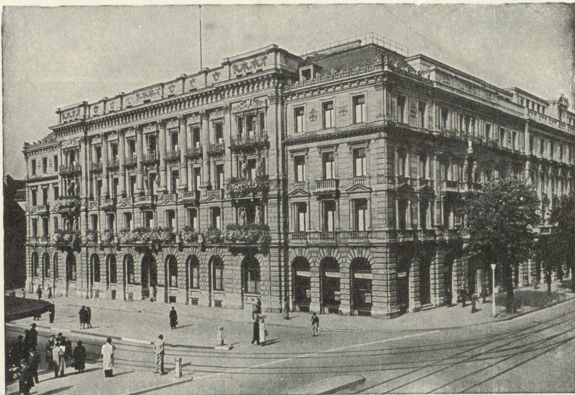
Hôtel de la Banque à Zurich