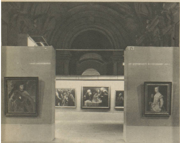
MUSEE DU PETIT-PALAIS. — Eclairage de la rotonde de la Peinture Flamande par incandescence et de la salle du Caravage par fluorescence.

Voilà quelques raisons pour lesquelles les Beaux-Arts s'efforcent, malgré la complexité des problèmes que soulève l'exécution d'un tel programme avec des crédits toujours insuffisants, de doter nos Musées d'un éclairage qui permette de prolonger leurs heures d'ouverture, et même de les ouvrir pendant la soirée, ou d'améliorer pendant les heures du jour, la présentation et l'éclairage des objets exposés au public.