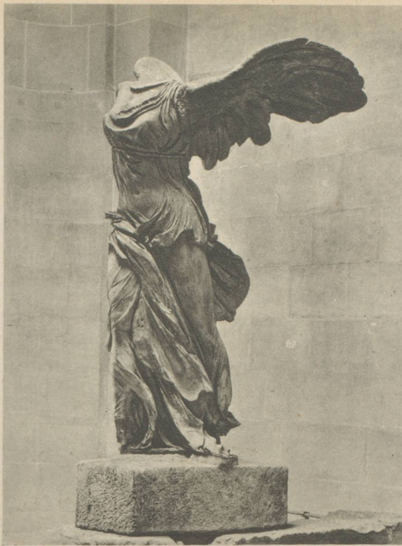
MUSEE DU LOUVRE. — La Victoire de Samothrace. (Eclairage par projecteurs.)