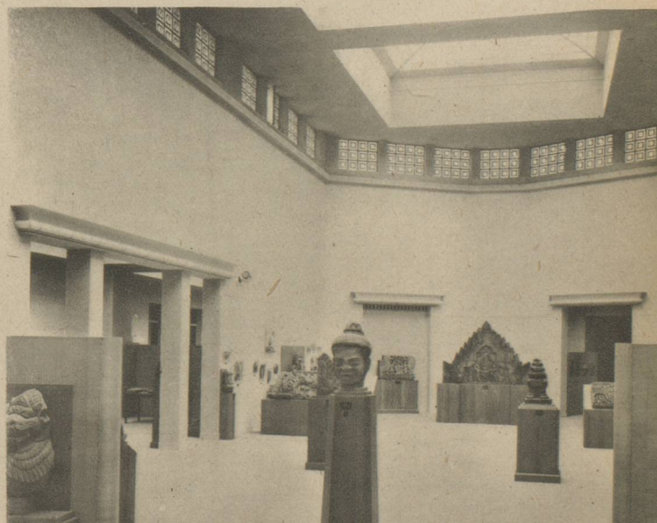
MUSEE GUIMET. — Grande salle du rez-de-chaussée (ancienne cour ; éclairage naturel).