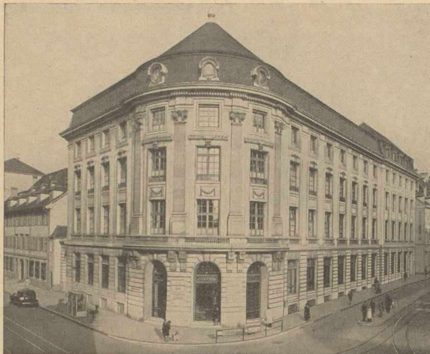
HOTEL DE LA BANQUE A BALE