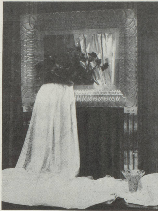
La quinzaine de la rose chez Lalique