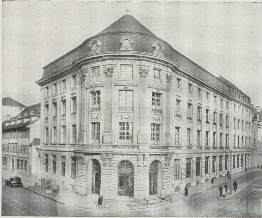
HOTEL DE LA BANQUE A BALE