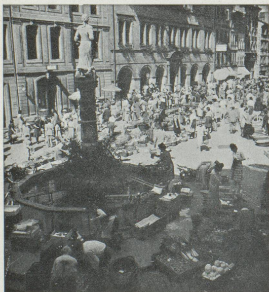
Jour de marché à Lausanne

pêche, les croisières sur le lac, les rendez-vous de plaisir. Lausanne, Montreux, Vevey.