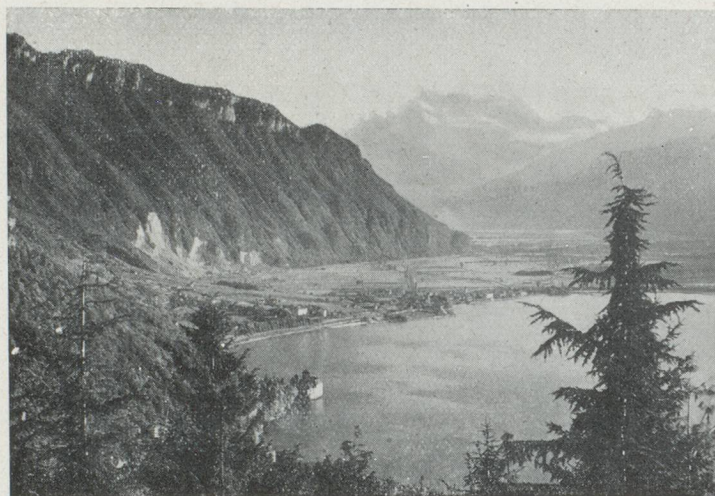
Environs de Montreux : vue sur le château de Chillon et les Dents du Midi

C'est le théâtre rêvé des vacances, la plage, la