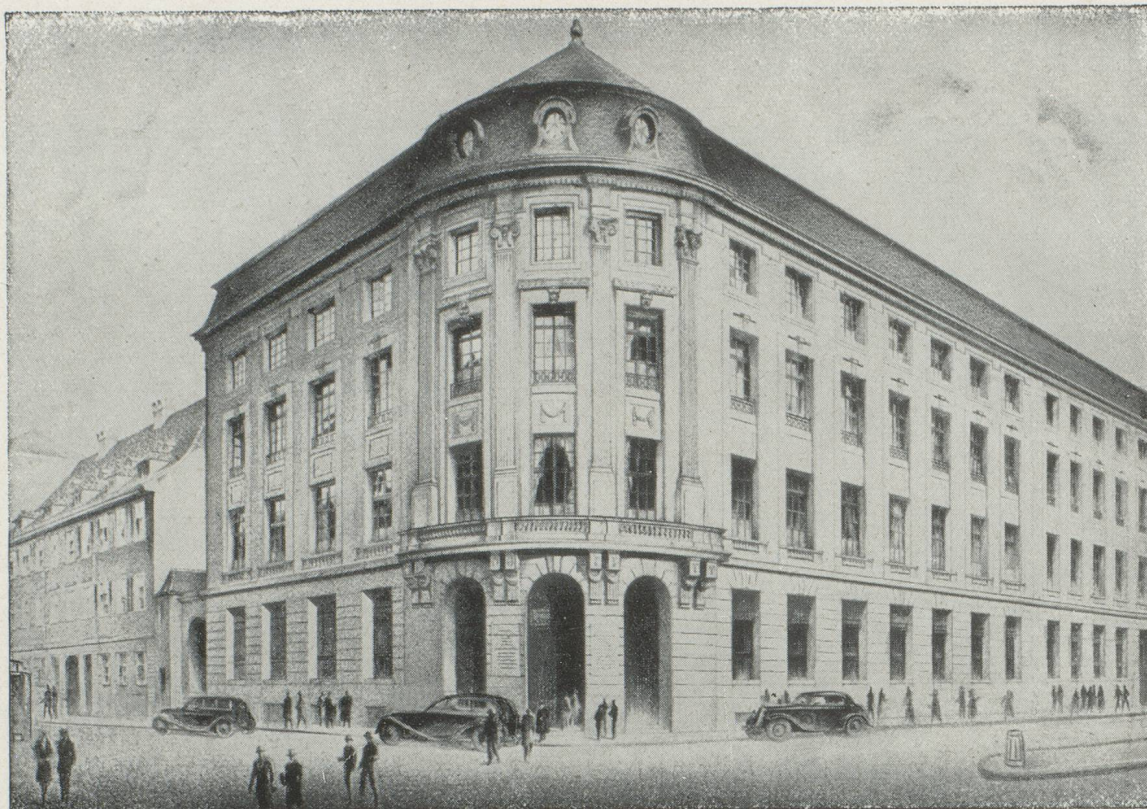
HOTEL DE LA BANQUE A BALE