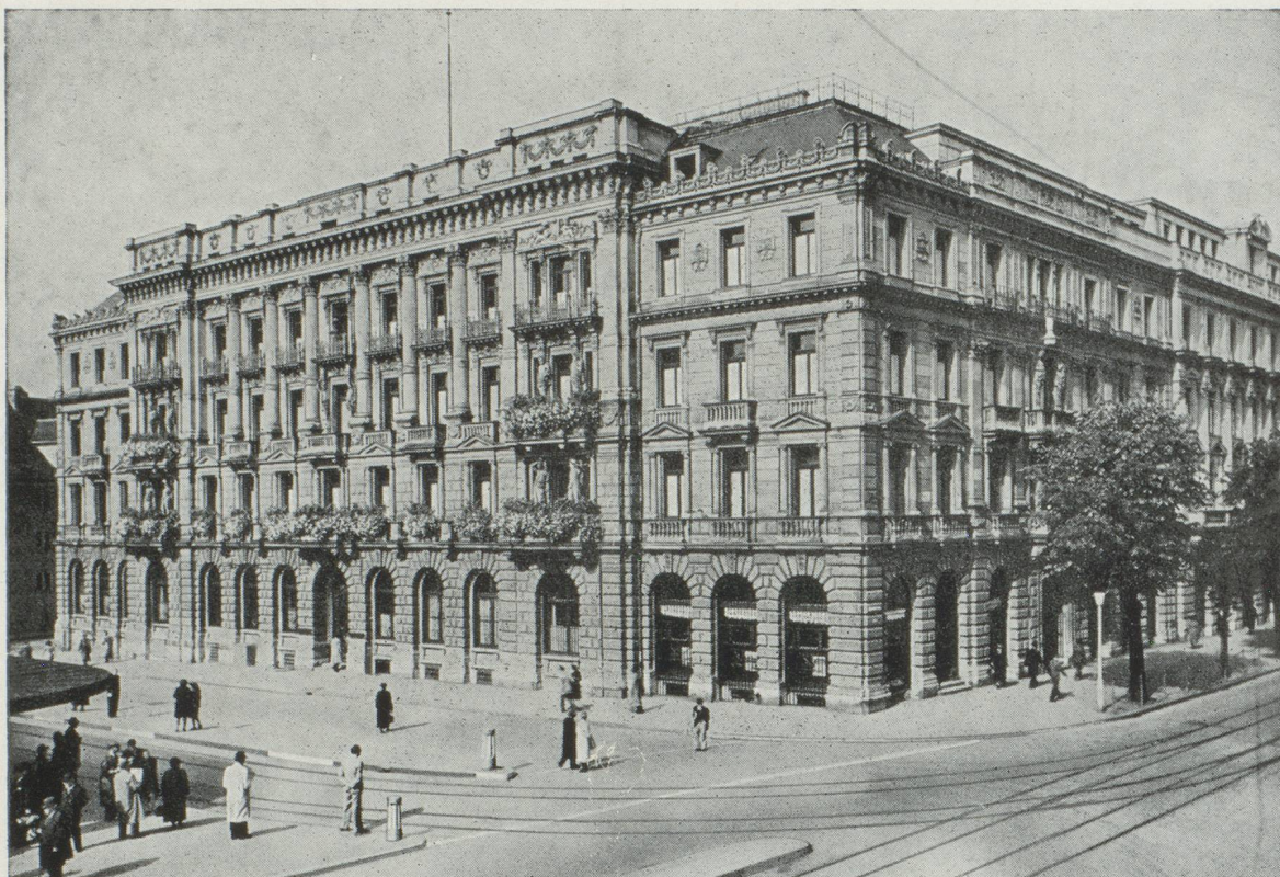
Hôtel de la Banque à Zurich