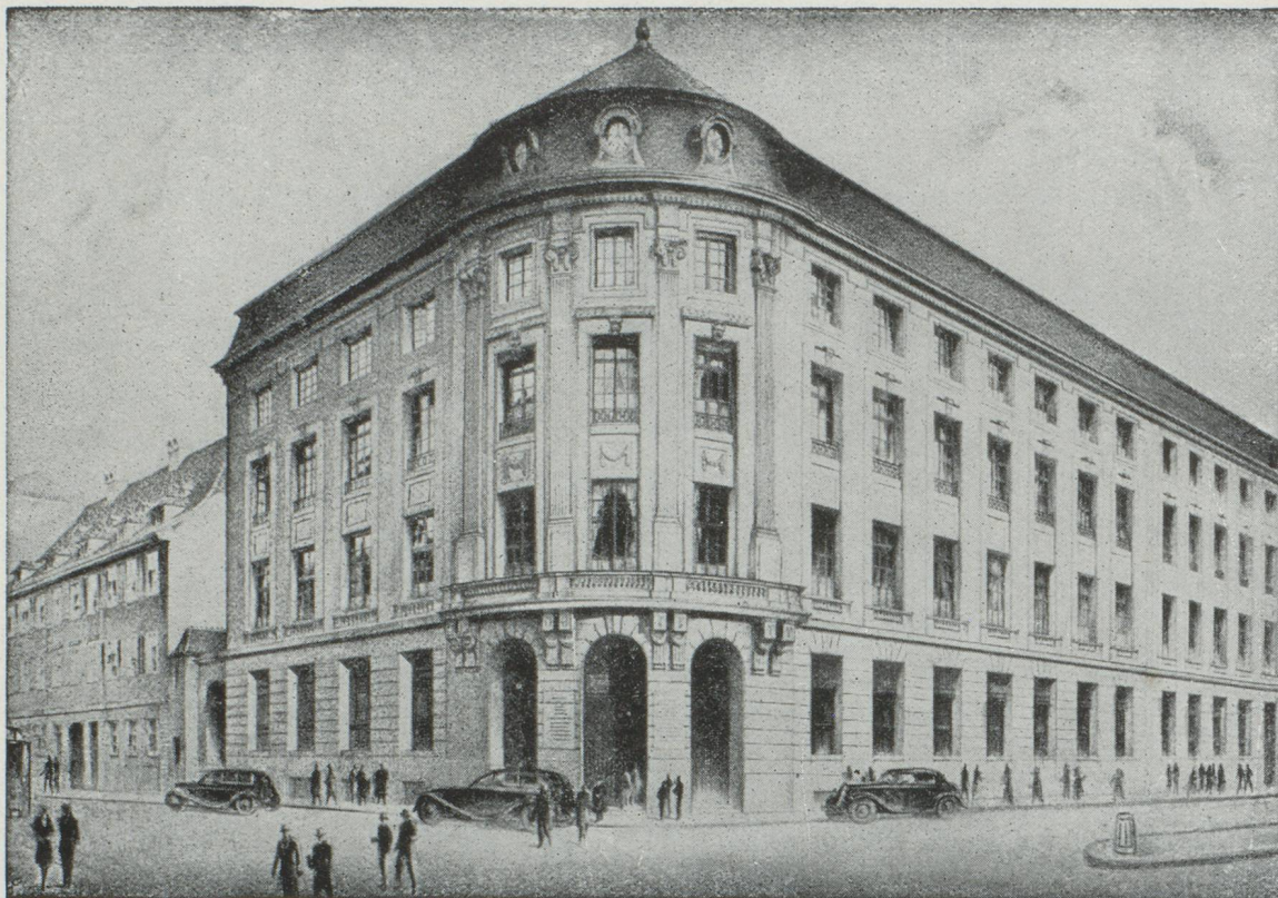
HOTEL DE LA BANQUE A BALE