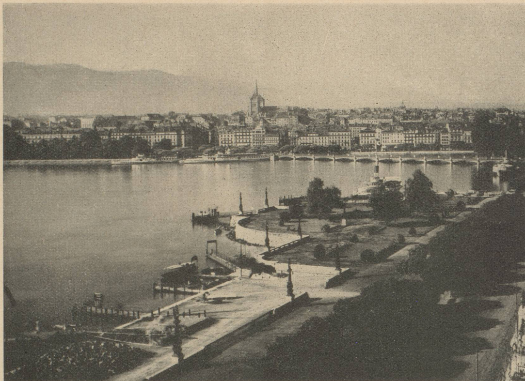
LA RADE DE GENÈVE

métiers qui en vivent, les arts mineurs et domestiques, tissages, broderies, dentelles, petites sculptures, poteries, les fromages et les laits, le bœuf puissant de Pâques, la truitelle exquise des ruisseaux, les légumes, les fruits, les fleurs jusqu'à l'edelweiss de nos sommets. Mais tout cela, c'est précisément le commerce, l'industrie et l'agriculture : une distinction risquerait d'être une division ».