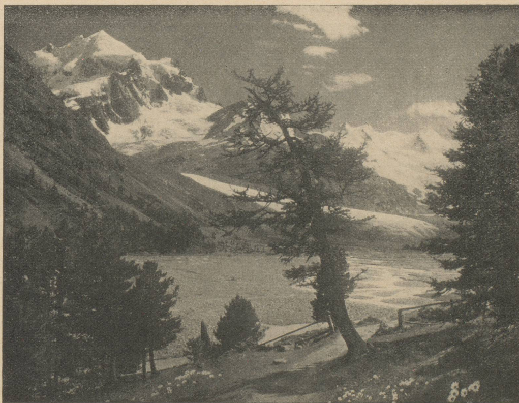
LE PARC NATIONAL (GRISONS)

A la suite de l'augmentation inespérée du tourisme national pendant la guerre — le nombre des nuitées d'hôtes suisses a sauté de 8 millions en 1937 à 14,7 millions en 1946 — on s'est demandé qu'elle pouvait en être la valeur économique. S'agissait-il là d'un simple déplacement d'argent, du transfert de pouvoir d'achat d'un endroit du pays à un autre, c'est-à-dire d'une opération technique sans effet économique? Si l'on répondait par l'affirmative on nierait par là-même l'importance du tourisme indigène en tant que facteur de l'économie nationale. Mais le bien-être du pays ne dépend pas seulement des chiffres absolus de son revenu et de sa fortune, il