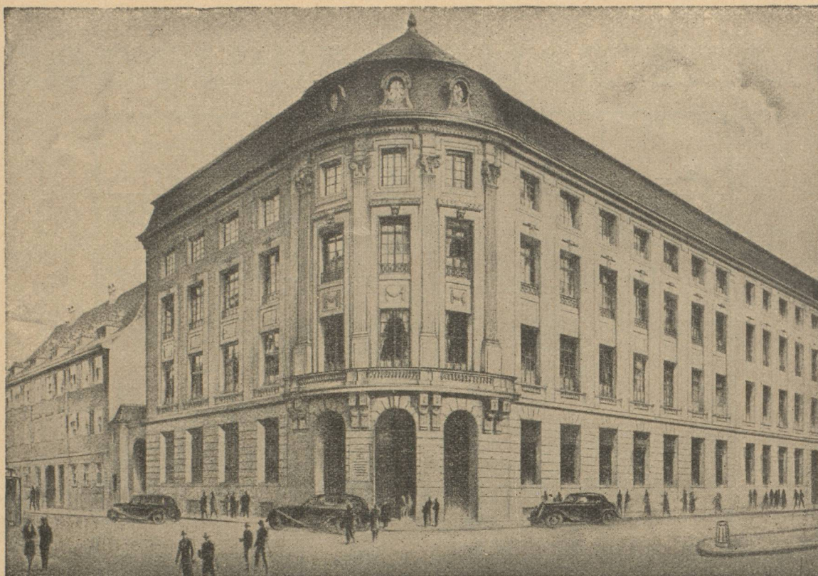
HOTEL DE LA BANQUE A BALE