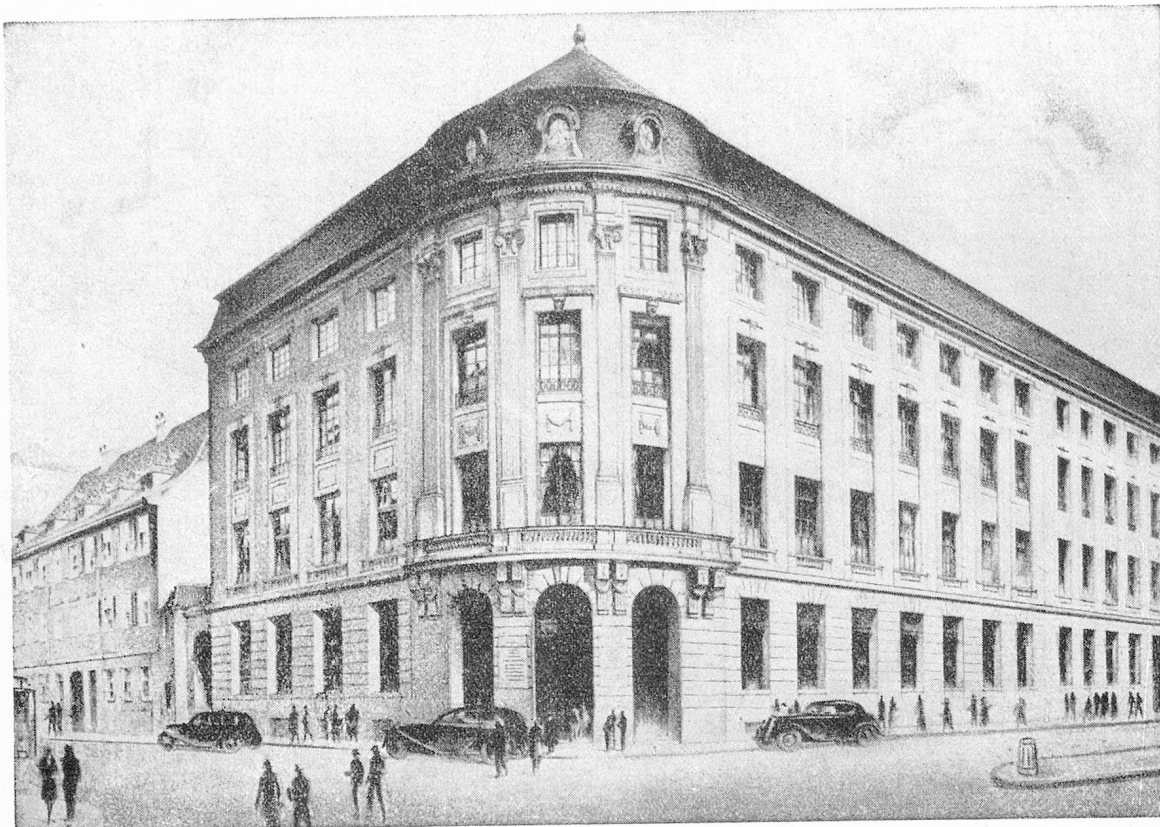
HOTEL DE LA BANQUE A BALE