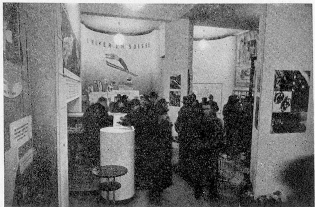
Stand Suisse à la Foire de Lyon : partie économique

La participation officielle suisse aux Foires de Lyon présentait, il y a une dizaine d'années, de modestes stands. Nous nous sommes attachés à la double tâche de faire comprendre, en Suisse, l'énorme importance de la Foire de Lyon et, à Lyon, l'avantage évident qu'il y avait à favoriser la propagande suisse. Les offices fédéraux nous ont toujours accordé leur confiance et nous ont chargés, en tout ou en partie, de l'aménagement du stand suisse à la Foire de Lyon. Nous avons rencontré à la Direction de la Foire