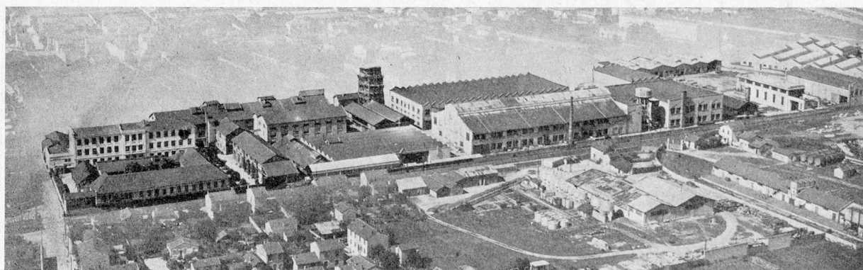
Ateliers de constructions électriques de Delle, Lyon-Villeurbanne. — Vue des bâtiments

Une amicale sportive met à la disposition des membres de la société, moyennant un montant modique d'adhésion, des terrains de sport, football, basket, tennis. Trois équipes de football association, une équipe masculine et une équipe féminine de basket défendent les couleurs Delle dans de nombreuses compétitions régionales.