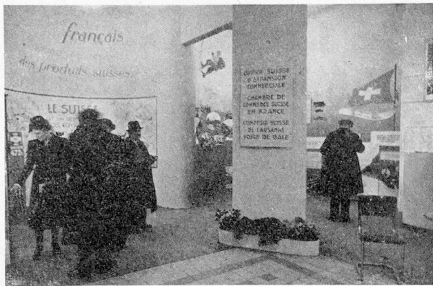
Stand Suisse à la Foire de Lyon : partie économique

lyonnaise; ses préoccupations ont été, et sont celles de tous ceux qui fabriquent et vendent, de tous ceux qui exportent ou s'efforcent de le faire.