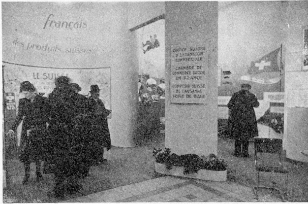
Stand Suisse à la Foire de Lyon : partie économique

lyonnaise; ses préoccupations ont été, et sont celles de tous ceux qui fabriquent et vendent, de tous ceux qui exportent ou s'efforcent de le faire.