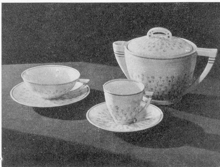
Service en porcelaine du Berry

Président de la Chambre syndicale des Fabricants de porcelaine du Berry.