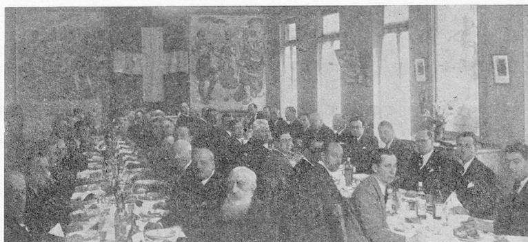
Déjeuner mensuel du 4 avril 1939 de la Section de Marseille

Président de la Section de Marseille de la Chambre de Commerce Suisse en France.