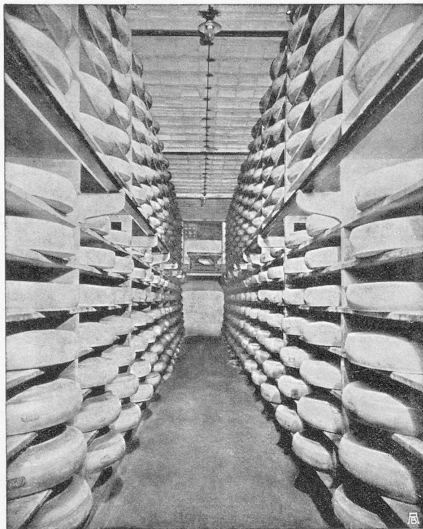
Une cave à « Emmental »

Vice-Président de la Chambre de Commerce Suisse en France.