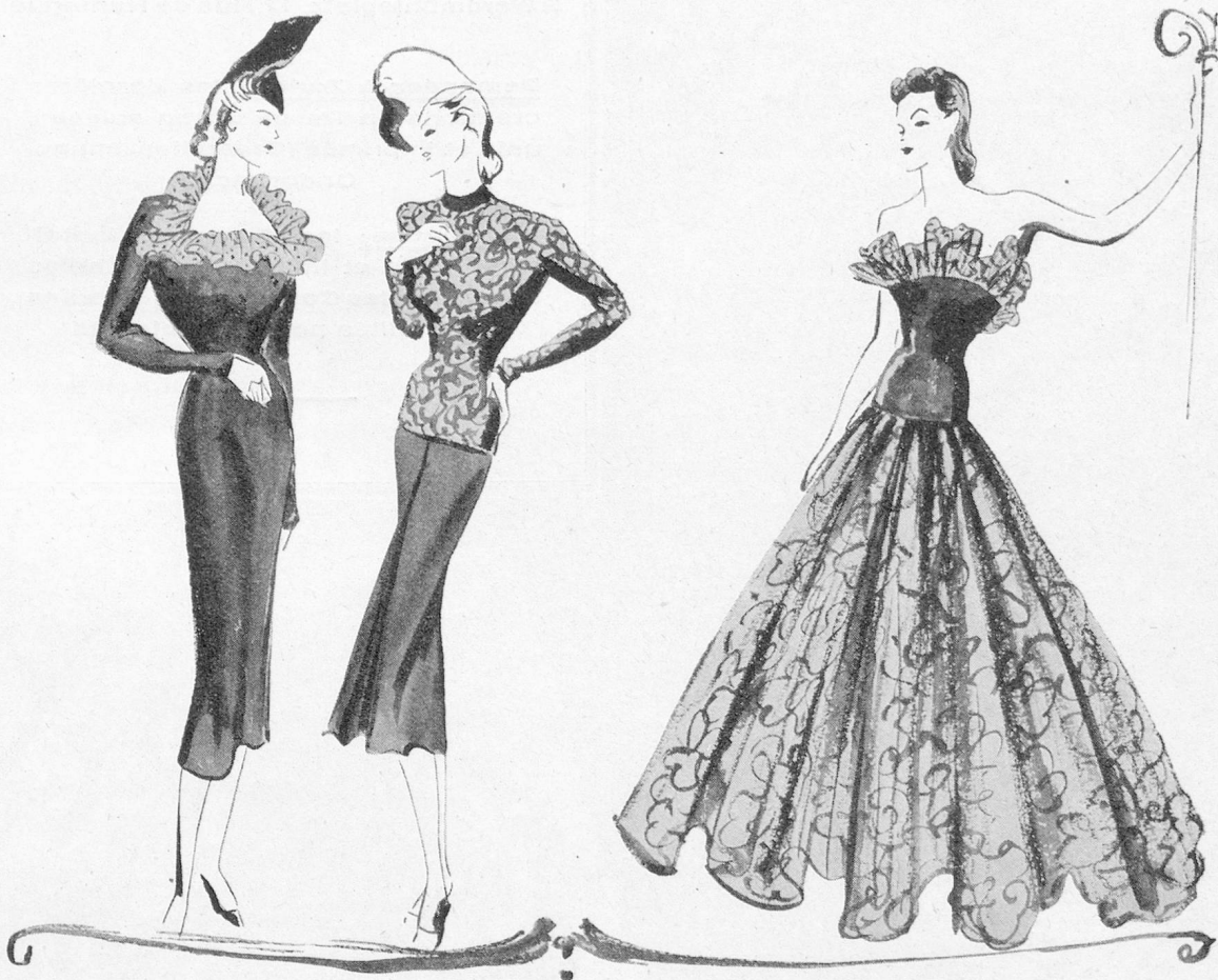
Créations de la Maison Robert Piguet

Les organdis et les linons brodés en formes