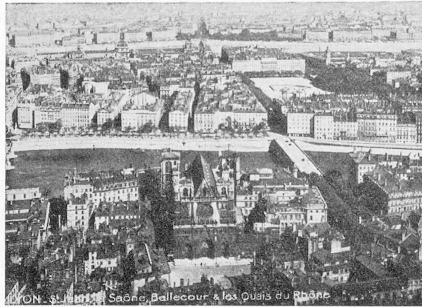
Vue de la ville de Lyon.

Pour 1938, les dates seront donc du samedi 12 au mardi 22 mars.