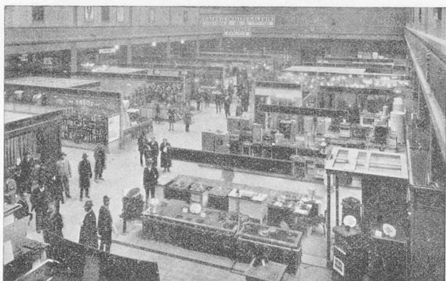
Une halle d'exposition de la Foire

B ALE, la cité rhénane, carrefour des routes européennes, la ville au grand passé, foyer de sciences, d'art et d'intense activité commerciale, convie pour la vingt-deuxième fois ses hôtes, du 26 mars au 5 avril, à la Foire Suisse d'Echantillons.