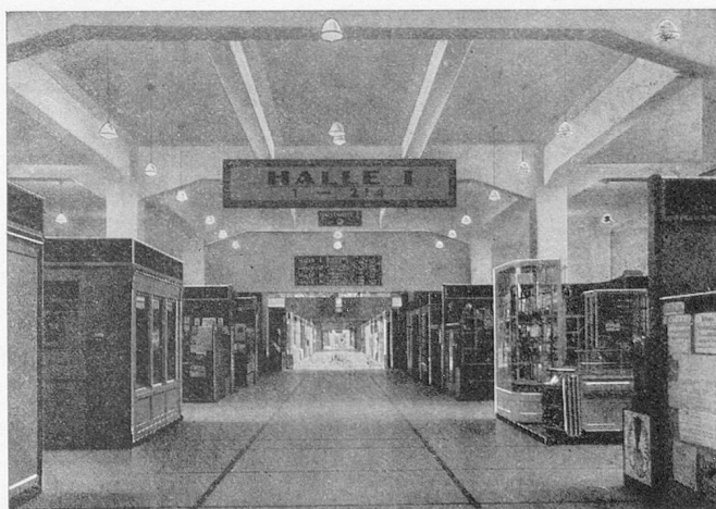
Une autre halle d'exposition

L'offre des industries diverses est ordonnée en vingt et un groupes réguliers et en Foires professionnelles et sections spéciales. Au nombre des groupes qui intéressent plus spécialement l'étranger, mentionnons ceux des produits textiles, de l'industrie électrique, des ustensiles de ménage, de la mécanique en général.