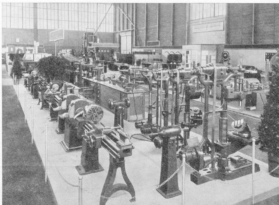
Exposition des machines-outils

Ajoutons enfin, — autre preuve de la considération internationale dont la Foire Suisse d'Echantillons est l'objet, — que dix-huit Etats européens accordent d'importantes réductions de leurs tarifs de transport aux visiteurs de la Foire. Les offices de représentation de la Foire Suisse d'Echantillons