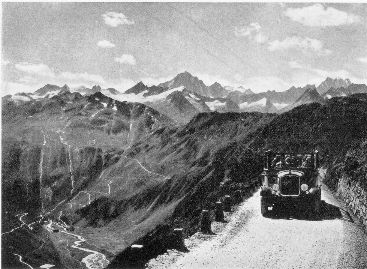
Col de la Furka

De la petite ville d'Andermatt, à peine connue du point de vue touristique, conduit vers le Sud une voie digne d'intérêt : il s'agit de la route du Saint-Gothard , à travers les gorges de la Trémola, dans le Tessin. Cette route est la ligne de prédilection pour le voyageur qui va sans se pres-