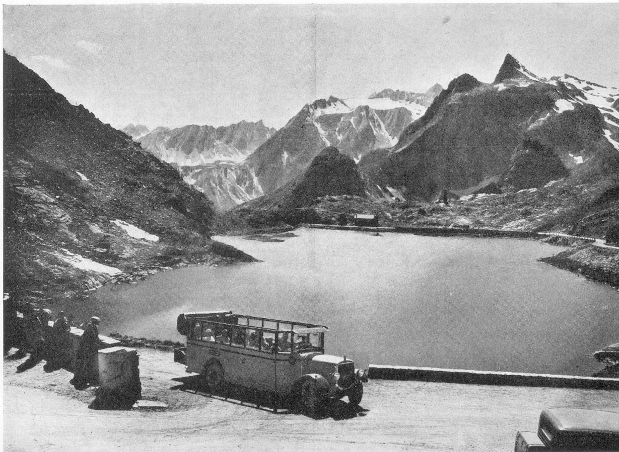
Le lac du Grand Saint-Bernard

Le pendant de la route de la Maloja dans la Haute-Engadine, est offert, dans la Basse-Enga-