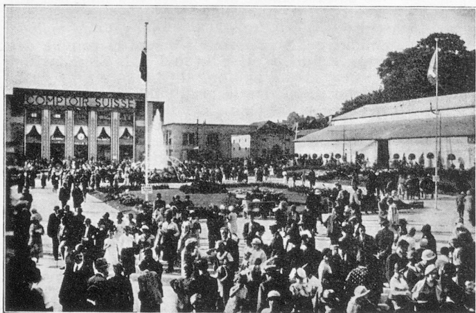
Les jardins et l'entrée de la Halle I

D'AUTRES MANIFESTATIONS SPÉCIALES : Expositions de Beaux-Arts, de Pisciculture (grand Aquarium, 30 bassins), Marchés, Concours de Bétail, d'Aviculture et de Cuniculture, etc., seront organisés pendant le Comptoir Suisse.