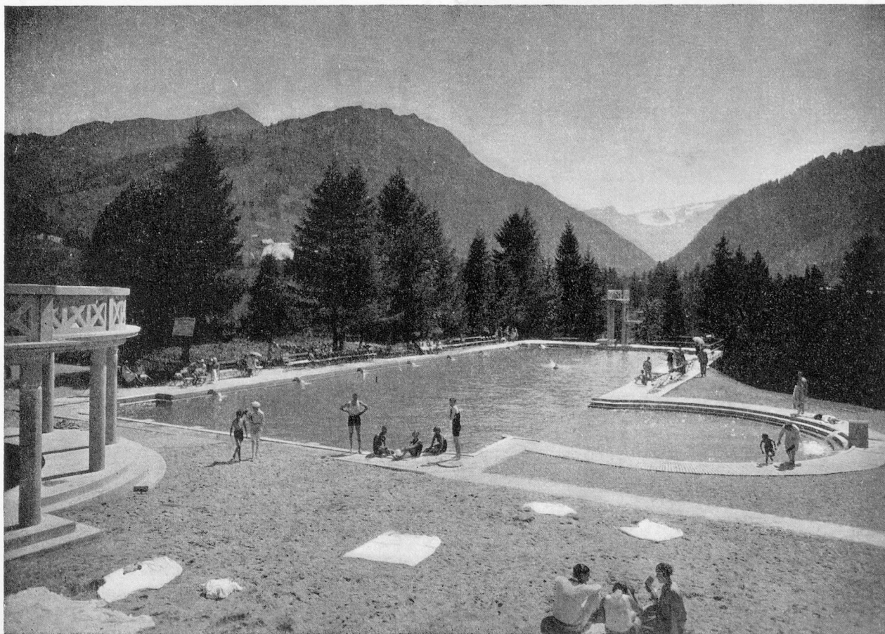
PISCINE DE GSTAAD