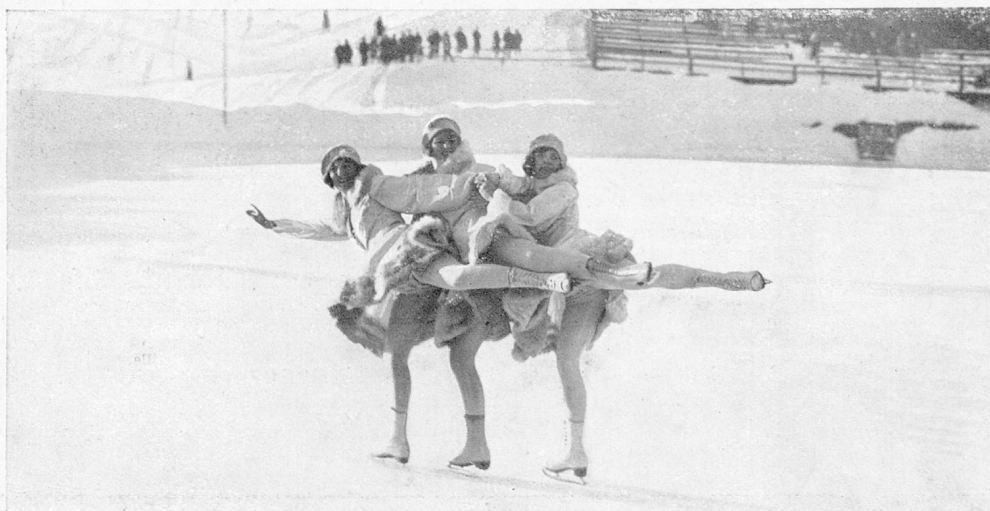
Patineuses à Saint-Moritz

Les adeptes des sports d'hiver n'ont donc que l'embarras du choix. De quelque côté qu'ils se dirigent en Suisse, ils sont sûrs de trouver durant la saison froide des installations sportives répondant à leurs goûts, des hôtels confortablement aménagés, puis la neige et la glace, conditions premières des sports, enfin l'air pur, le soleil resplendissant, les cirques de haute montagne, les panoramas éblouissants. En faut-il davantage pour que les montagnes de la Suisse attirent d'année en année, en nombre toujours croissant, ceux qui sentent le besoin d'abandonner les préoccupations absorbantes de la ville, l'atmosphère fumeuse et poussiéreuse des grands centres, l'humidité et les brouillards de la plaine pour se retremper à la montagne, au milieu de paysages ensoleillés et d'une nature idéalement belle!