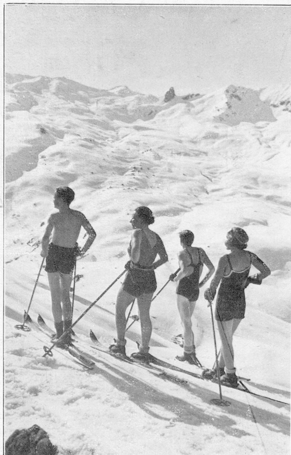
Skieurs près d'Arosa