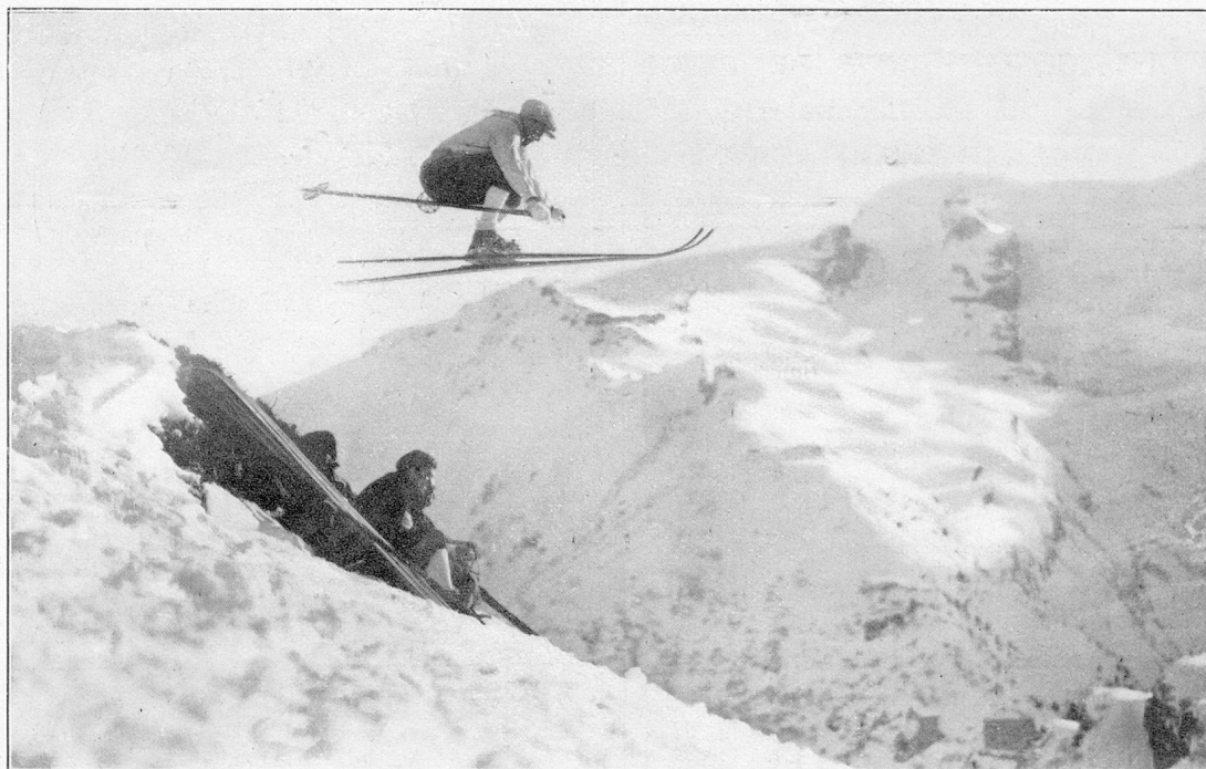
Saut en ski

ses formes bizarres, exige un alerte déploiement de force et permet d'utiliser d'un cœur léger toute la vigueur et toute l'impatience de la jeunesse. Comme le spécialiste du telemark, le sauteur de terrain fait des haltes sur le chemin du sommet, mais sa flânerie est un excès de joie, un aimable délire où débordent sa santé physique, désireuse d'opposer aux perfidies de la montagne ses bonds de lièvre et ses acrobaties. Il ne connaît ni la montée laborieuse et soutenue, ni la flânerie réfléchie et pleine de charme, mais il émaille son parcours de ses caprices endiables et de ses tours amusants : demi-tours sautés, virages sautés en hauteur, vrilles et sauts périlleux. Tout cela pour