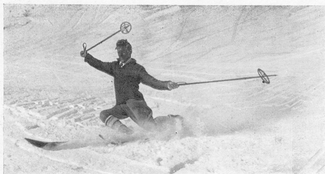
Christiania, exécuté par M. Dahinden