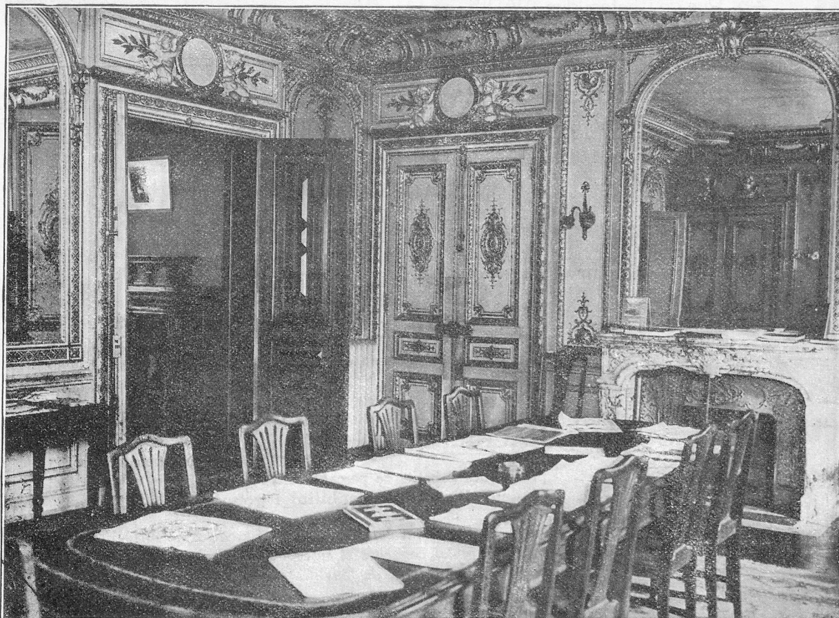
Salle de lecture et de conférences de la Chambre de Commerce Suisse en France.

Soieries Gessner, S. A. Fabricants de soieries, Lyon.