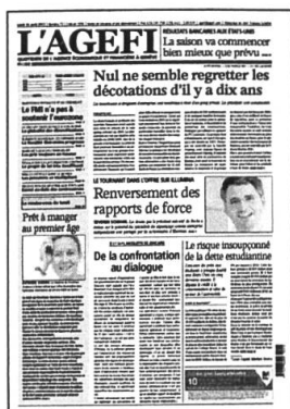
Lu - Ve Kiosque / Abonnement

Retrouvez l'intégralité de nos contenus sur www.agefi.com