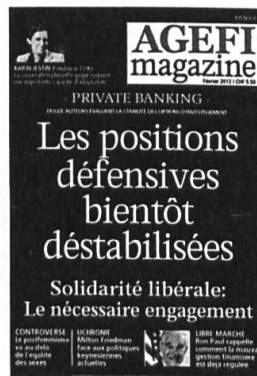
6 parutions Kiosque / Abonnement