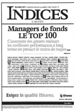
Mensuel Encarté dans L'Agefi