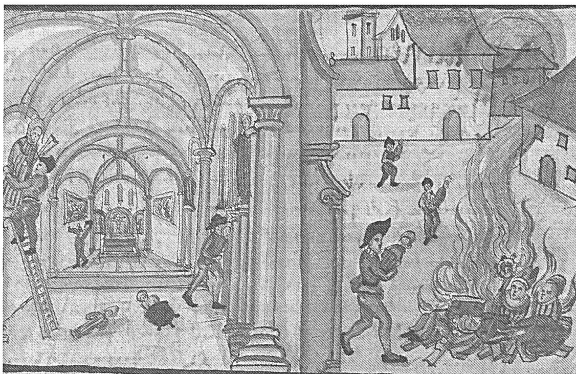
Fig. 5 Le retrait des images dans les églises à Zurich, tiré de la copie illustrée par Heinrich Thomann de l'Histoire de la Réformation de Bullinger, 1605, Zentralbibliothek Zürich, ms. B 316.

une sacralité de l'espace qui multiplie les statues de saints, les croix et les chapelles, dessinant une topographie jalonnée de marqueurs de catholicité. Encerclée dès 1536 par les possessions bernoises réformées, Fribourg traduit ainsi son attachement à la cause catholique par la multiplication des images saintes ou l'accueil de fondations monastiques, et bientôt, des jésuites. Ces politiques ont laissé des traces jusqu'à nos jours: franchir la frontière actuelle entre le canton de Berne et le canton de Fribourg, c'est aussi passer d'un espace dépourvu de signes religieux à un paysage rythmé par les croix et les chapelles dédiées à la Vierge et aux saints, et où pèlerinages et processions continuent à faire exister les itinéraires du sacré disparus des terres protestantes.