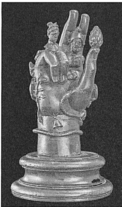
Fig. 2 Main votive en bronze destinée au culte du dieu Sabazios, Avenches (VD).

Les commerçants et autres soldats, se déplaçant constamment d'un bout à l'autre de l'Empire, participeront à l'introduction et au développement de religions orientales dans toutes les provinces. C'est ainsi que les dieux Isis, Mithra, Orphée ou Sabazios (fig. 2) occupent une place importante dans le paysage religieux de l'époque. Souvent caractérisés par des cultes dit «à mystères», c'est-à-dire nécessitant une initiation, ces dieux se retrouvent fréquemment sous forme de représentations figurées (sculptures, peintures, mosaïques, etc.), mais également lorsque des objets en lien avec leurs liturgies sont mis au jour ou parfois lors de la découverte de lieux de cultes, tels que les mithraea , édifices consacrés au dieu Mithra. Sur le territoire suisse actuel, deux mithraea sont connus à ce jour, l'un découvert à Orbe et l'autre à Martigny, et de nombreux objets et représentations en rapport avec des cultes orientaux sont attestés. Mentionnons par exemple une main votive caractéristique du culte de Sabazios provenant d'Avenches, un bas-relief représentant le dieu égyptien Anubis (fig. 3) ou encore un sistre en bronze, objet rituel du culte d'Isis, tous deux mis au jour à Lausanne-Vidy.