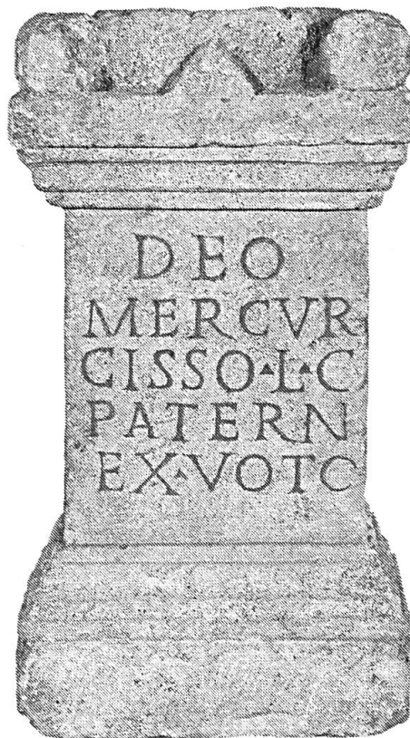
Fig. 1 Autel dédié à Mercure Cissonius, Avenches (VD).