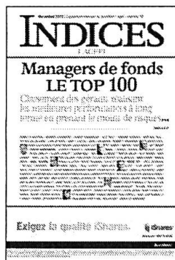
Mensuel Encarté dans L'Agefi