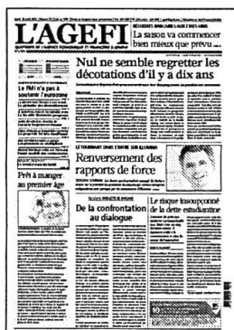
Lu - Ve Kiosque / Abonnement

Retrouvez l'intégralité de nos contenus sur www.agefi.com