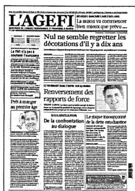
Lu - Ve Kiosque / Abonnement

Retrouvez l'intégralité de nos contenus sur www.agefi.com