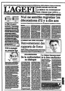
Lu - Ve Kiosque / Abonnement

Retrouvez l'intégralité de nos contenus sur www.agefi.com