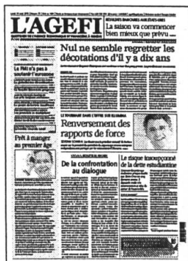
Lu - Ve Kiosque / Abonnement

Retrouvez l'intégralité de nos contenus sur www.agefi.com