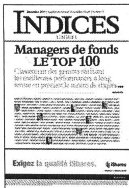
Mensuel Encarté dans L'Agefi