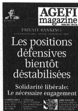
6 parutions Kiosque / Abonnement