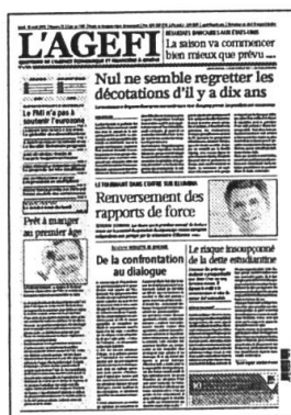
Lu - Ve Kiosque / Abonnement

Retrouvez l'intégralité de nos contenus sur www.agefi.com