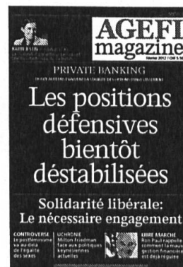
6 parutions Kiosque / Abonnement