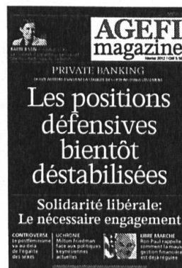
6 parutions Kiosque / Abonnement