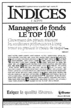
Mensuel Encarté dans L'Agefi