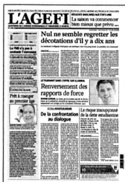
Lu - Ve Kiosque / Abonnement

Retrouvez l'intégralité de nos contenus sur www.agefi.com