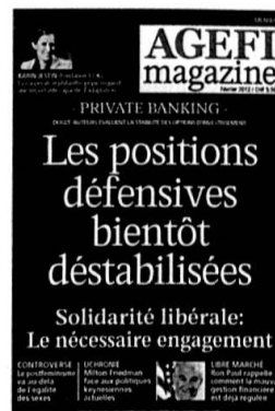
6 parutions Kiosque / Abonnement