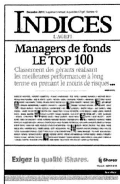
Mensuel Encarté dans L'Agefi