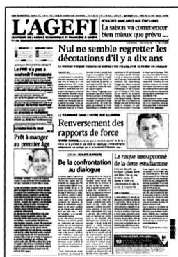
Lu - Ve Kiosque / Abonnement

Retrouvez l'intégralité de nos contenus sur www.agefi.com