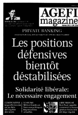
6 parutions Kiosque / Abonnement