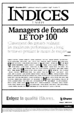
Mensuel Encarté dans L'Agefi