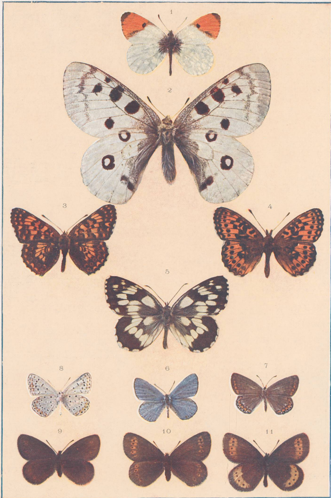
Gravures et impression Sadag, Sécheron-Genève.

Reproduction sur nature par le procédé de Trichromogravure S.A.D.A.G., Sécheron-Genève