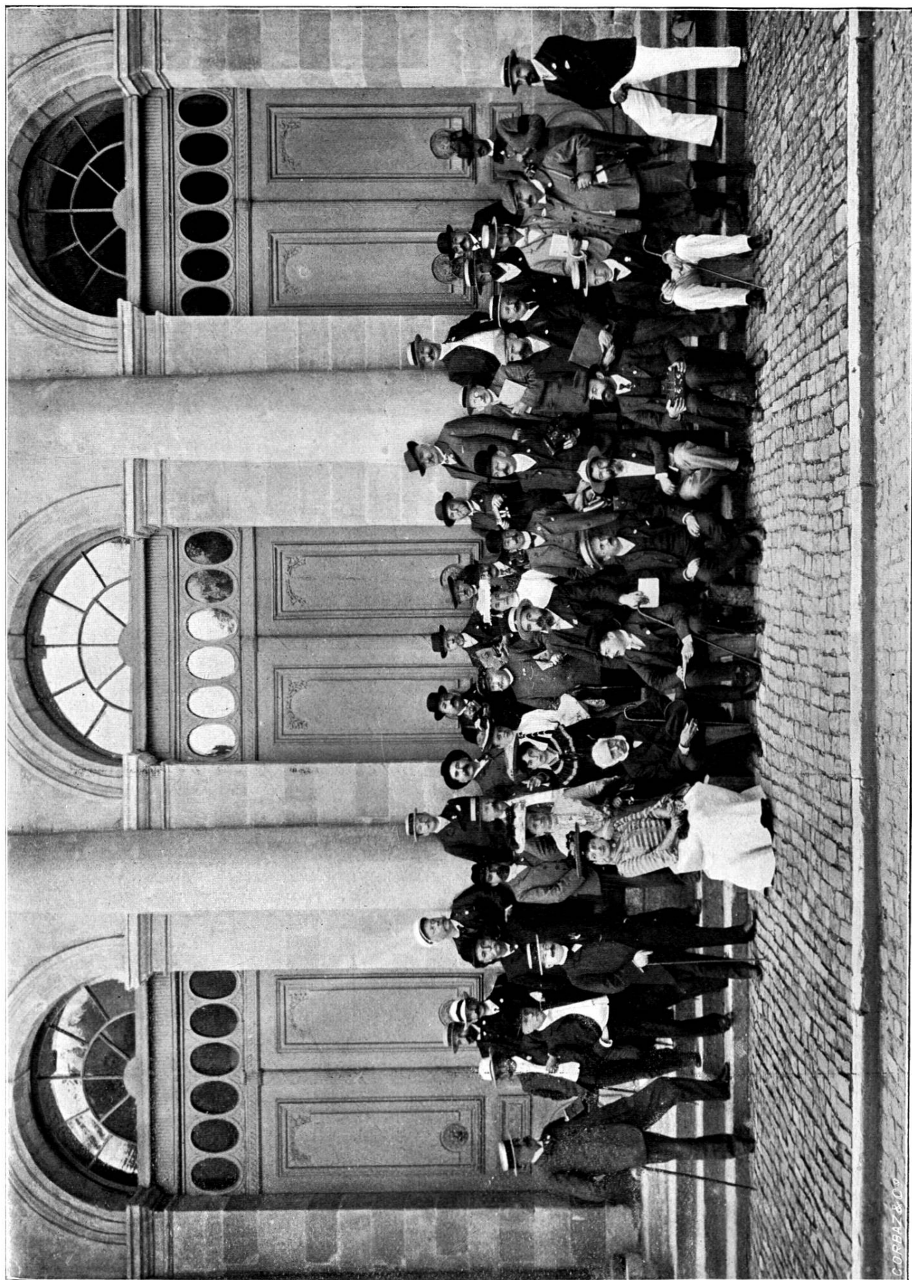
Les participants à la XI e session de l'Union Internationale de Photographie, à Lausanne.