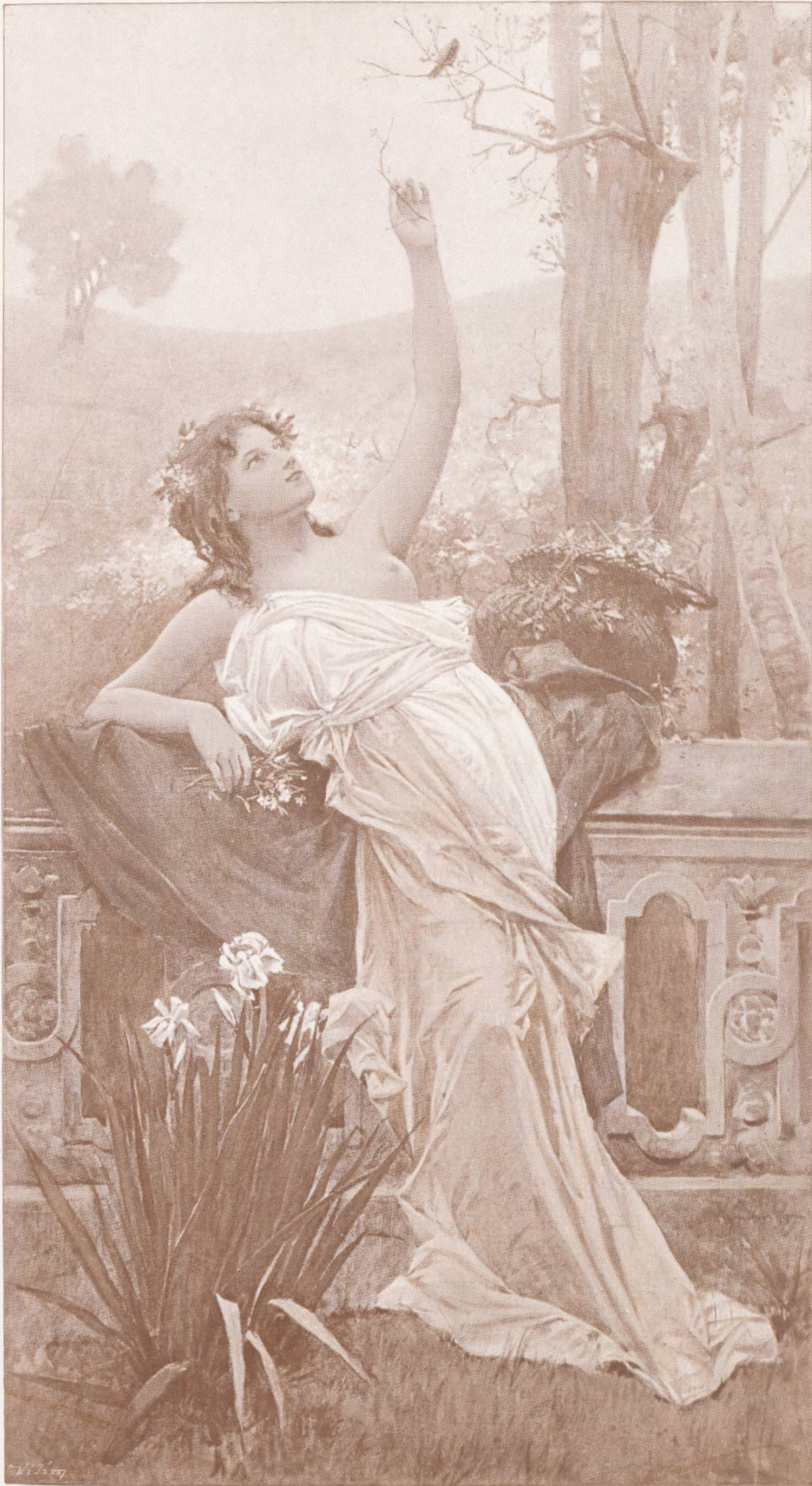
Phototypes en trois couleurs de J. Vilim.