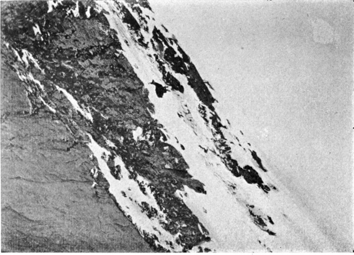
Similigravure : Brooke & Kuhne, Genève.