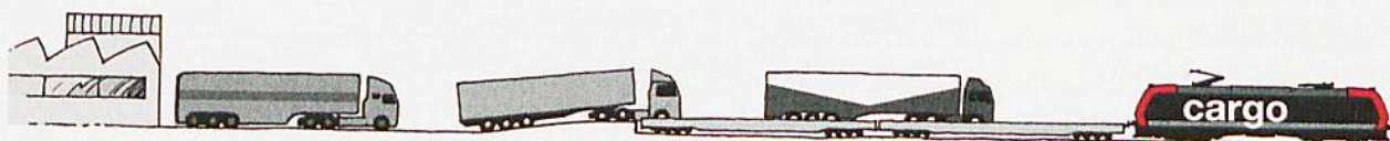
Trafic combiné non accompagné: chaussée roulante