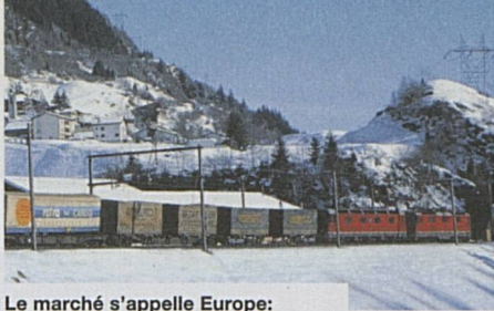
Le marché s'appelle Europe: train marchandises au Gothard