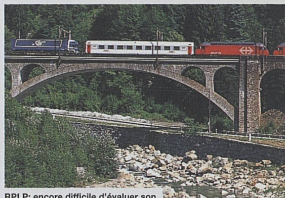
RPLP: encore difficile d'évaluer son impact sur le rail

Pour leur Autoroute roulante sur l'axe Lötschberg-Simplon, Hupac, BLS et CFF fondent une société d'exploitants, à laquelle chacun participe à raison de 30 pour cent; les derniers 10 pour cent, réservés aux FS italiens, étant provisoirement détenus par les CFF. La mise en service a, hélas! pris du retard. Des problèmes géologiques ont ralenti les travaux des FS pour élargir les profils d'espace libre sur la rampe sud du Simplon. Ces travaux achevés, le projet débutera par quatre paires de trains quotidiennes