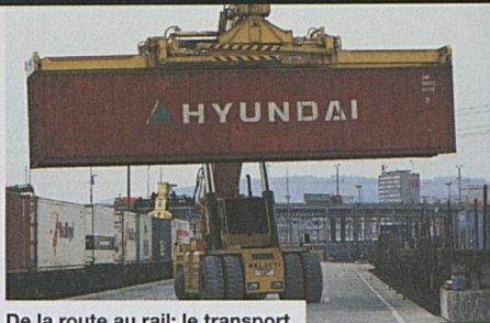
De la route au rail: le transport combiné a toujours le vent en poupe

entre Fribourg-en-Brisgau et Bâle, au nord, Domodossola et Novare, au sud. A partir de 2002, l'offre augmentera chaque année en fonction de la demande. Avec 21 paires de trains, il sera possible de transporter à travers les Alpes chaque jour 1260 camions et chaque année 315 000. L'année dernière, avec l'offre existante des CFF et de Hupac pour la chaussée roulante nationale, le transport combiné transalpin a augmenté de 3,5 pour cent. Le transport combiné non accompagné, jugé meilleur d'un point de vue logistique, a enregistré une hausse qui a même atteint 18,8 pour cent.