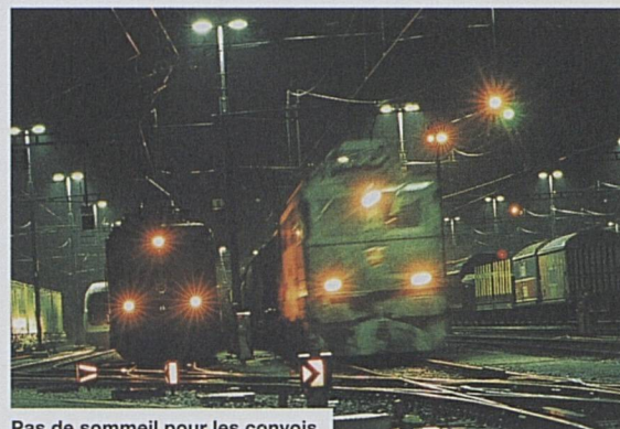
Pas de sommeil pour les convois marchandises: transport 24 heures sur 24

capacités sur les lignes, les trains marchandises se trouvaient immobilisés à la frontière. Ces engorgements ont mis clairement en évidence les carences d'une planification et d'une gestion de la production limitées à la dimension nationale. L'amélioration de la production dans le trafic transalpin est un impératif prioritaire. Les CFF entendent satisfaire aux exigences de leur clientèle pour la qualité du transport.