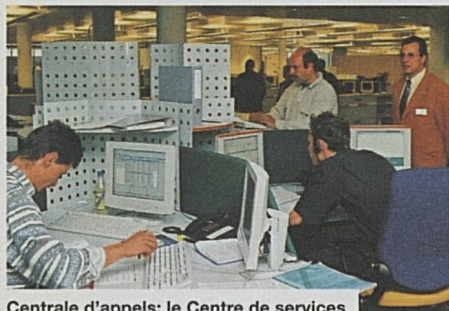
Centrale d'appels: le Centre de services clientèle Cargo, à Fribourg

Le KSC est entré en service en avril et, depuis lors, il a peu à peu repris les activités jusque-là assurées par un grand nombre de gares. A la fin de 2000, 54 pour cent de tous les transports étaient gérés par les 173 personnes qui travaillaient à Fribourg; le transfert des activités à la centrale KSC, depuis 800 et quelques gares, sera terminé en mai 2001, et les services disséminés seront allégés d'autant. Pendant son premier exercice, la nouvelle centrale des relations avec la clientèle a traité 54 656 appels téléphoniques et 128 226 fax.