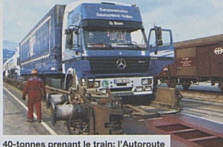
40-tonnes prenant le train: l'Autoroute roulante – plus que jamais nécessaire