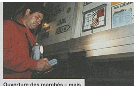
Ouverture des marchés – mais les contrôles subsistent aux frontières

L'année dernière, CFF Cargo a enregistré de nouveaux records tant pour les tonnages que pour les prestations. Ces résultats sont, pour une part, liés aux transports exceptionnels de bois à la suite de l'ouragan Lothar. Sur la voie qui conduit à la nouvelle organisation de CFF Cargo, la mise en activité d'un Centre de services clientèle a marqué une étape importante.