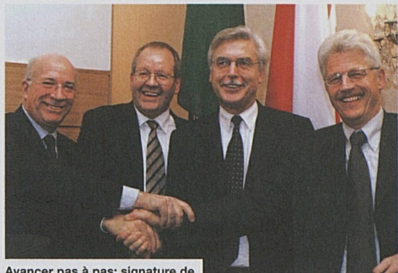
Avancer pas à pas: signature de l'accord avec les FS à Rome

A l'échelon international, CFF Cargo apporte un savoir-faire important, une approche qualité affirmée et une bonne