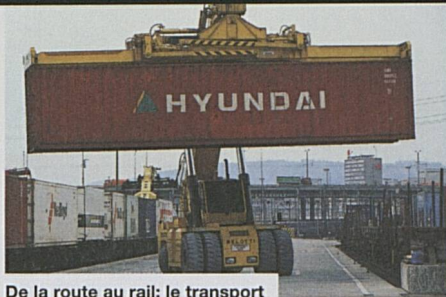
De la route au rail: le transport combiné a toujours le vent en poupe

entre Fribourg-en-Brisgau et Bâle, au nord, Domodossola et Novare, au sud. A partir de 2002, l'offre augmentera chaque année en fonction de la demande. Avec 21 paires de trains, il sera possible de transporter à travers les Alpes chaque jour 1260 camions et chaque année 315 000. L'année dernière, avec l'offre existante des CFF et de Hupac pour la chaussée roulante nationale, le transport combiné transalpin a augmenté de 3,5 pour cent. Le transport combiné non accompagné, jugé meilleur d'un point de vue logistique, a enregistré une hausse qui a même atteint 18,8 pour cent.