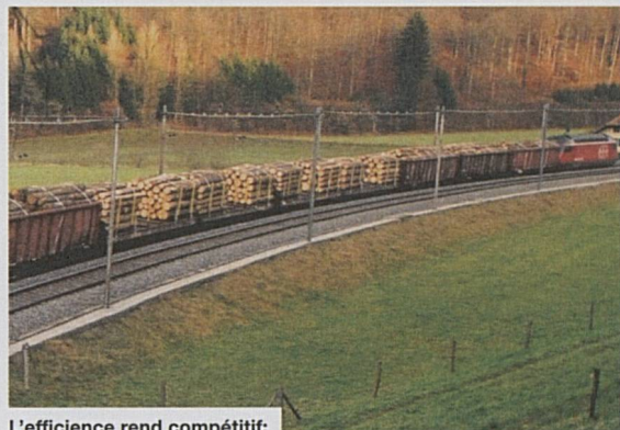
L'efficacité rend compétitif: les trains – plus ils sont longs, mieux c'est

Plus efficace, CFF Cargo devient aussi plus compétitif, notamment pour gagner des parts de marché et, partant, pour décharger la route – un résultat bienvenu, écologiquement parlant aussi. Les marchés du transport des marchandises ne relâchent pas leur pression sur les prix, d'où un effort de longue haleine nécessaire pour augmenter la productivité. En 2000, avec des effectifs serrés, parfois même insuffisants, le trafic marchandises CFF a réalisé de nouveaux records. Le 19 octobre, plus de 100 000 tonnes ont pour la première fois franchi le Gothard vers le Sud. A ce trafic généralement soutenu se sont ajoutés les transports de bois occasionnés par l'ouragan Lothar, à la fin de 1999.