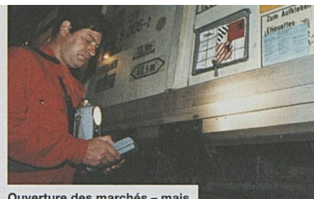
Ouverture des marchés – mais les contrôles subsistent aux frontières

L'année dernière, CFF Cargo a enregistré de nouveaux records tant pour les tonnages que pour les prestations. Ces résultats sont, pour une part, liés aux transports exceptionnels de bois à la suite de l'ouragan Lothar. Sur la voie qui conduit à la nouvelle organisation de CFF Cargo, la mise en activité d'un Centre de services clientèle a marqué une étape importante.