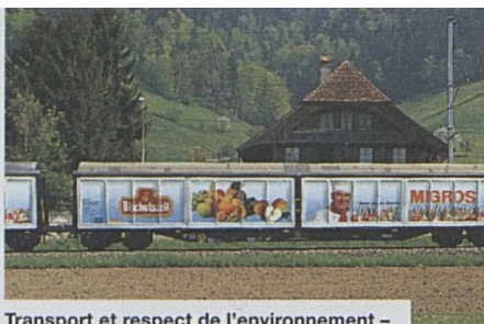
Transport et respect de l'environnement – desserte marchandises dans tout le pays