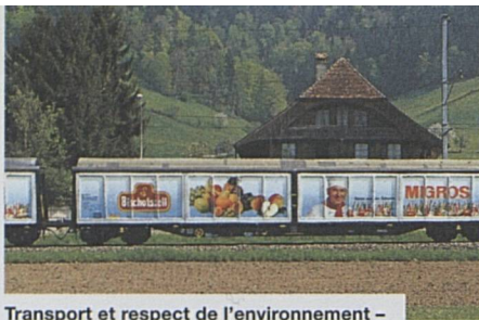
Transport et respect de l'environnement – desserte marchandises dans tout le pays