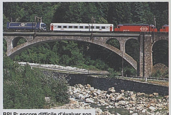
RPLP: encore difficile d'évaluer son impact sur le rail

Pour leur Autoroute roulante sur l'axe Lötschberg-Simplon, Hupac, BLS et CFF fondent une société d'exploitants, à laquelle chacun participe à raison de 30 pour cent; les derniers 10 pour cent, réservés aux FS italiens, étant provisoirement détenus par les CFF. La mise en service a, hélas! pris du retard. Des problèmes géologiques ont ralenti les travaux des FS pour élargir les profils d'espace libre sur la rampe sud du Simplon. Ces travaux achevés, le projet débutera par quatre paires de trains quotidiennes