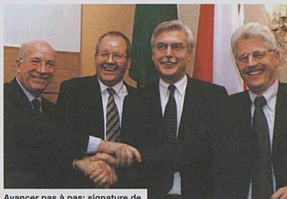
Avancer pas à pas: signature de l'accord avec les FS à Rome

A l'échelon international, CFF Cargo apporte un savoir-faire important, une approche qualité affirmée et une bonne