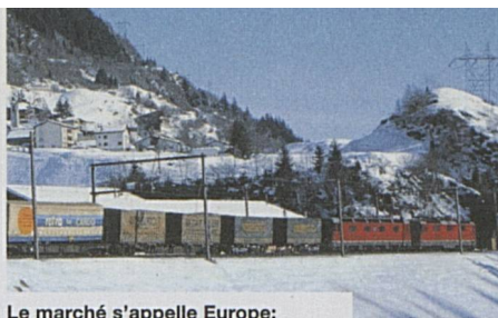
Le marché s'appelle Europe: train marchandises au Gothard