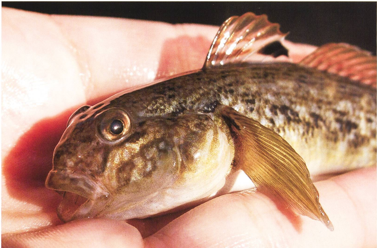
Abb. 1 Schwarzmundgrundel aus dem Rhein bei Basel in einer Handfläche.