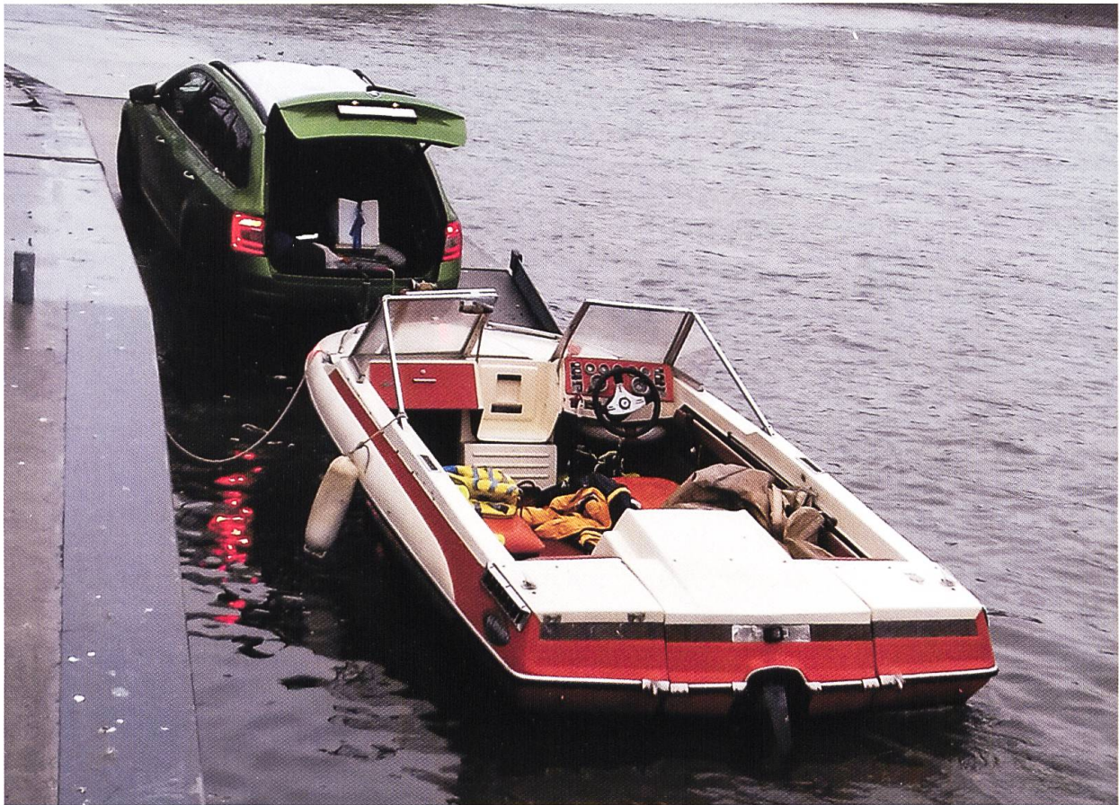
Abb. 2 Slipvorgang eines Sportbootes im Rhein bei Basel. Sportboote werden als wichtiger Verbreitungsweg für Schwarzmundgrundeln vermutet, da sie einige Winkel und Ecken bieten, in denen Eier oder lebende Individuen auch längere Strecken über Land überleben könnten.

tungsverlauf informiert zu sein. Im Rahmen präventiver Massnahmen sollte die Verschleppung der Schwarzmundgrundel in andere Gewässer verhindert werden. Mögliche Ausbreitungswege wurden identifiziert und die Relevanz für die Ausbreitung bewertet.