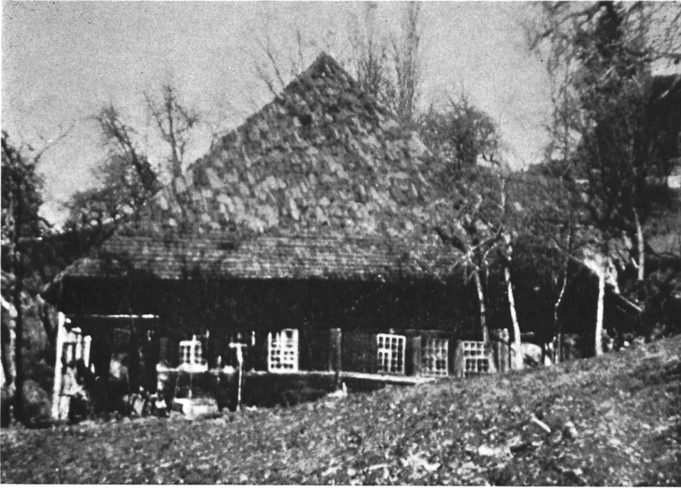
Abb. 3 Der alte untere «Sepper» auf der Glasbachweid, Rohrbachgraben, abgebrochen 1952. Der typische, noch nicht mit Schindeln bedeckte Schild überdeckte die auf dem Bild nicht sichtbare Laube und liess nur die Fensterfront des Erdgeschosses, gegen Osten orientiert, frei. Links und rechts neben der eigentlichen Hauswand der vom überragenden Dach geschützte «Schopf», nach aussen meist nochmals durch eine Wetterwand geschützt. Normalerweise geht die Hauptfensterfront gegen Süden. Hier, wie auch anderwärts, passt sich das Haus dem Hang an, wegen der bergseitigen Einfahrt, unbekümmert um Aussicht und Südlage, die durch die Wetterwand versperrt sind.

chen 809 Stück Käse zu durchschnittlich 80 kg und 9700 kg Butter hergestellt wurden.