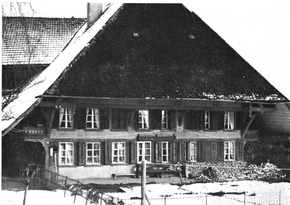
Abb. 5 200jähriges Bauernhaus auf dem Gansenberg, Gemeinde Rohrbachgraben, südliche Fensterfront. Das Haus liegt am Osthang, so dass die bergseitige Einfahrt auf der Westflanke angebaut ist. Der noch mit Schindeln bedeckte Dachschild gibt schon die Fensterfront des ersten Stockes frei. Die noch knapp sichtbare Laube der Südfront ist nachträglich nach aussen geschlossen worden, um den Dachboden von innen zu erweitern. Dafür befindet sich je westlich und östlich über dem «Schopf» eine offene Laube, allerdings durch das Dach überragt. Diese Lauben sind nicht mit denjenigen des Berner Oberlandes an Aussichtslage vergleichbar. Sie dienen vorwiegend wirtschaftlichen Zwecken.