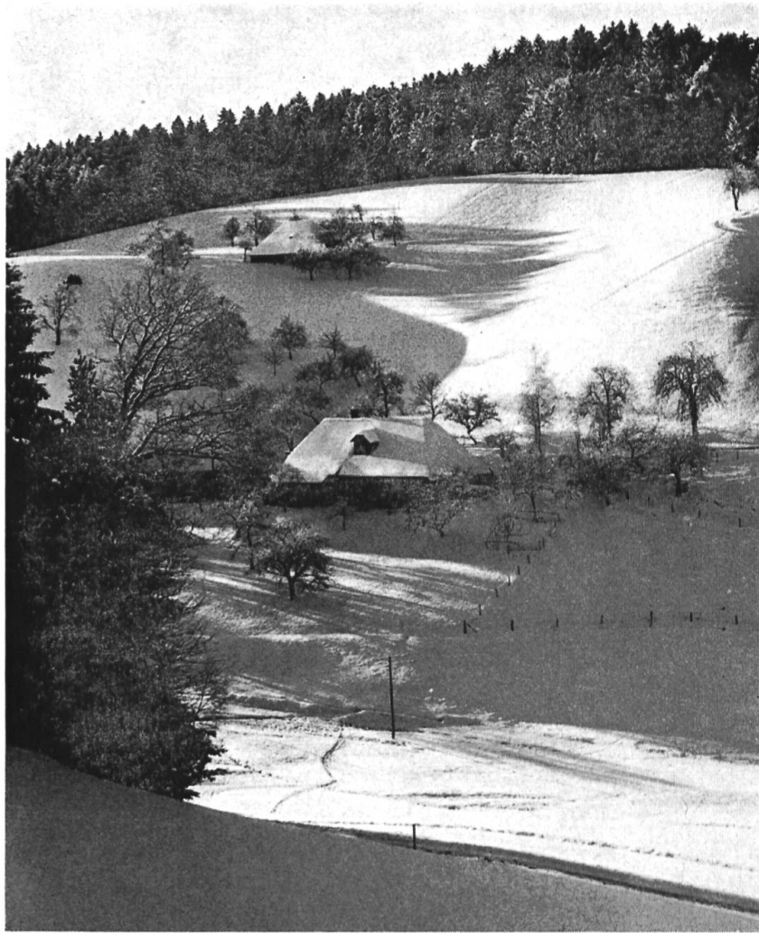
Abb. 1 Zwei Höfe im Rohrbachgraben: oben «Dängeli», unten «Dubeloch». — Fig. 1 Deux fermes du Rohrbachgraben: en-haut «Dängeli», en-bas «Dubeloch».

alten Steinbruch der Unterbau aus grauem Sandstein mit der darüber gelagerten Nagelfluhdecke. Dort wurde früher das Material für die Grund- und Stützmauern der Bauernhäuser bezogen 2 .