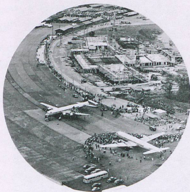
Con la costruzione dell'aeroporto internazionale di Zurigo inizia un nuovo capitolo per il turismo svizzero.

I colpi di genio nell'ambito della creatività erano già richiesti negli anni Trenta della grande crisi. Su tutta la Svizzera pesa il marchio di «isola dai prezzi alti». Senza indugiare si attirano dunque nel nostro Paese gli automobilisti grazie alla «benzina turistica a prezzo ribassato», si creano pacchetti per «coppie fresche di matrimonio» e si riducono i prezzi delle guide alpine. Negli anni Settanta, nel quadro della crisi petrolifera, ci si appella nuovamente alle menti creative del turismo svizzero. Le parole marziali del direttore dell'UNST Kämpfen alla sua «truppa» sono chiare: «La miglior difesa è l'attacco!» In poco tempo si realizza un catalogo con 300 offerte estive e i passeggeri della Swissair ricevono una nuova guida degli alberghi. Slogan come «Die Schweiz – für Ihr Geld Ferien wie Gold» (La Svizzera, vacanze d'oro per il vostro denaro) rivelano le modalità con cui la Svizzera intende vendersi. «Reisen nach Mass statt Massentourismus» (Viaggi su misura invece del turismo di massa) indica la linea da seguire: ci si concentra sulla promozione del turismo individuale attento alla qualità.