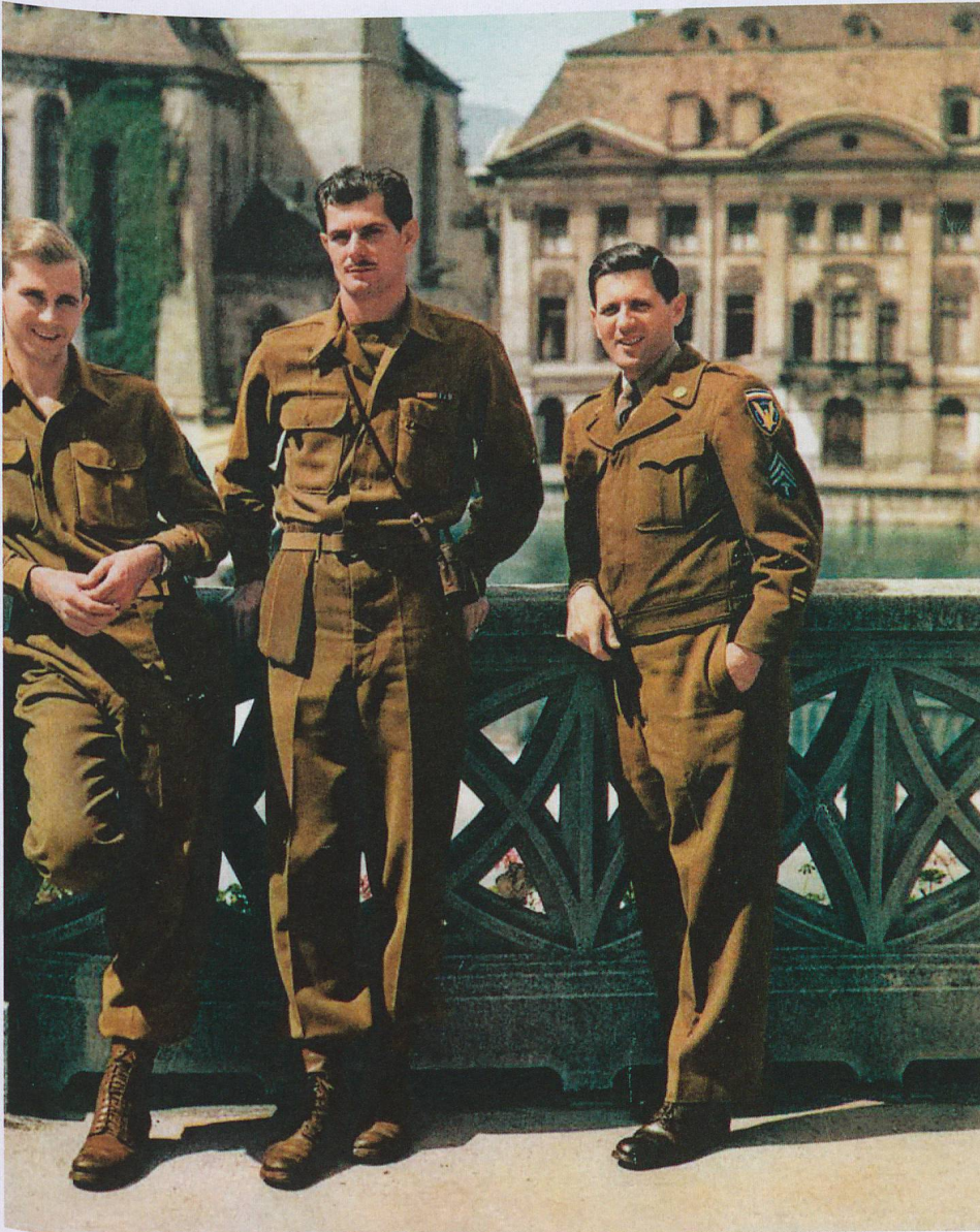
Premiato il coraggio creativo: i soldati americani in qualità di ambasciatori pubblicitari contribuiscono alla ripresa del turismo dopo la Seconda guerra mondiale.