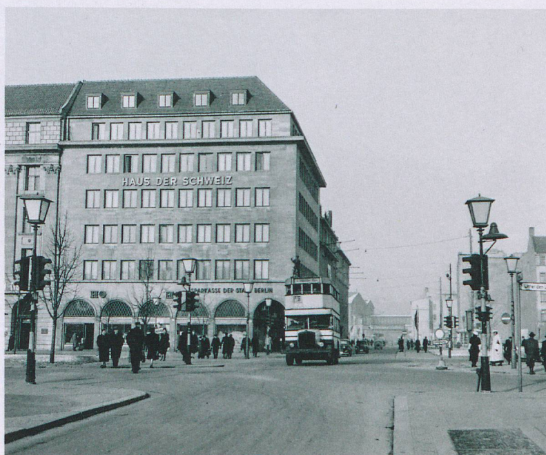
«La Casa della Svizzera» di Berlino: anche durante la Seconda guerra mondiale resta saldamente in mani svizzere.