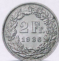
A causa della situazione finanziaria, la Confederazione svaluta il franco svizzero.