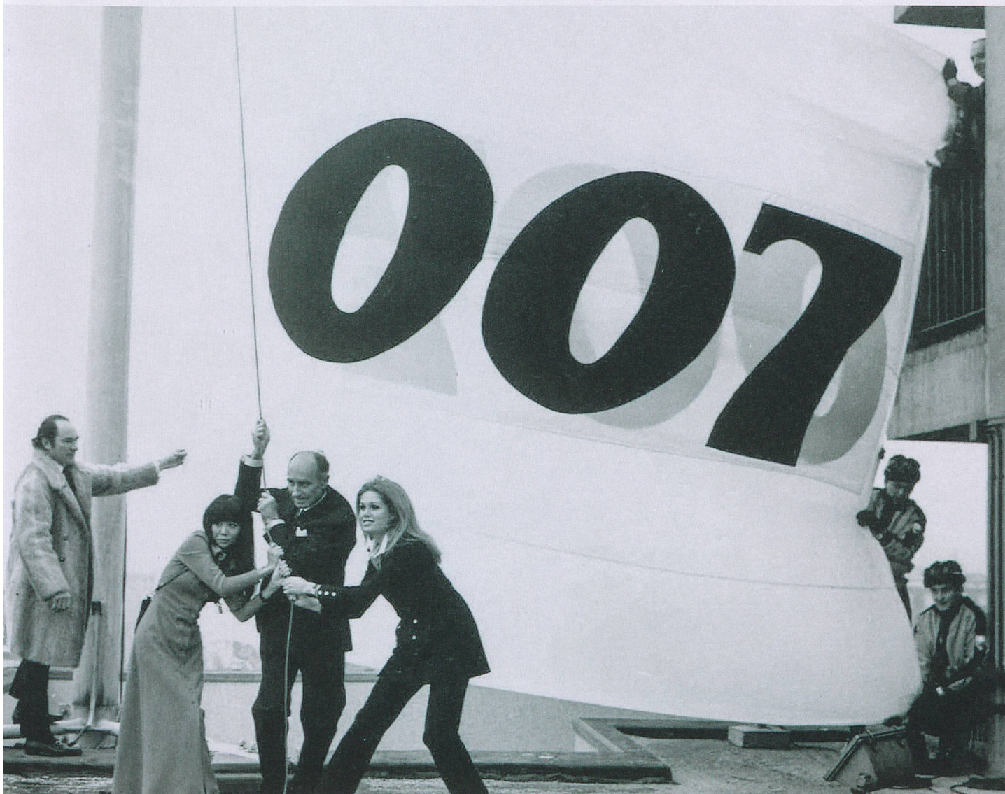
007 sul tetto dello Swiss Centre di Londra: in Gran Bretagna si pubblica il nuovo episodio di James Bond girato in Svizzera.