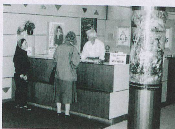
L'UNST apre un ufficio di rappresentanza a Stoccolma al fine di promuovere turisticamente la Svizzera anche in Scandinavia. Dopo una breve interruzione, Svizzera Turismo oggi è di nuovo presente in Svezia.