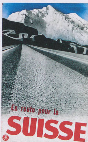
Prima campagna pubblicitaria per il turismo automobilistico. «All roads lead to Switzerland», un fotomontaggio di Herbert Matter.

Negli ultimi vent'anni Svizzera Turismo ha scritto un capitolo del tutto nuovo. Non importa se a Pechino, New York, Amsterdam o Dubai: le 26 sedi all'estero si sono trasformate da classici uffici turistici a piattaforme di marketing (in accordo con la sede centrale di Zurigo), che grazie a piccole e grandi iniziative continuano a promuovere la Svizzera come meta turistica.