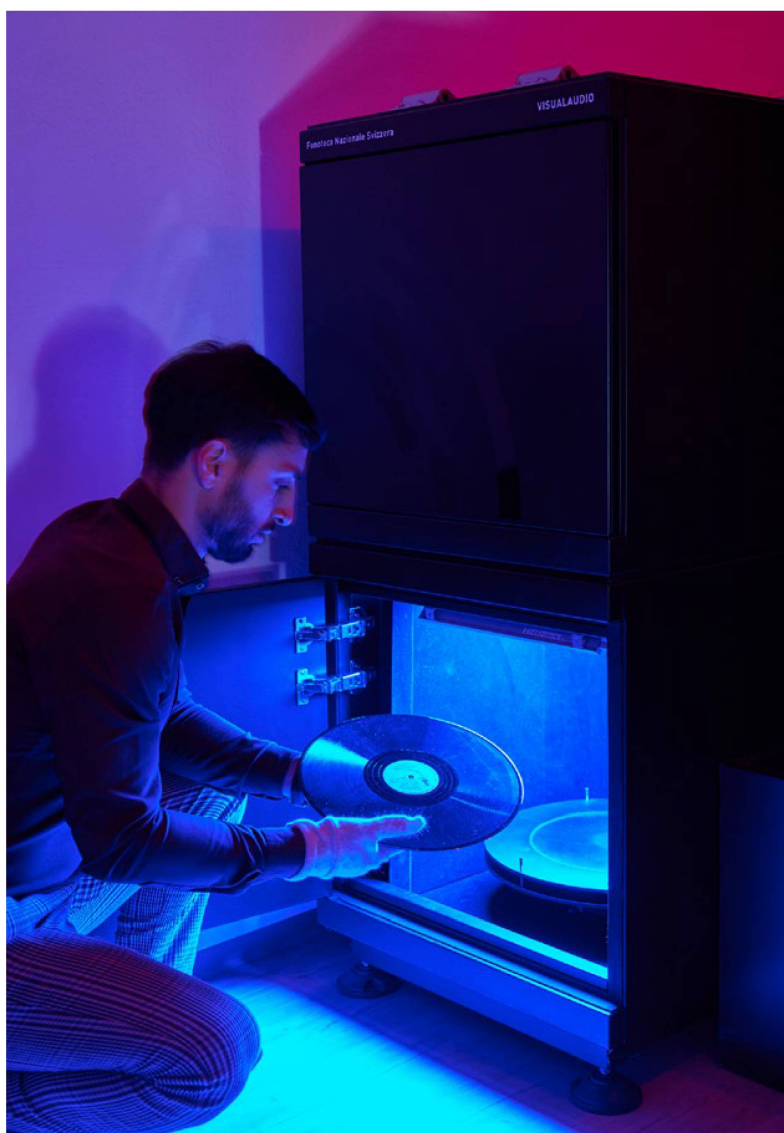
VisualAudio: saving the sound of broken records

Nell'anno in rassegna la Fonoteca ha rafforzato la propria rete nazionale e internazionale partecipando a vari convegni e congressi. A giugno ha tenuto la conferenza online VisualAudio: saving the sound of broken records , organizzata dalla Zentralbibliothek Zürich, dall'Association of International Librarians and Information Specialists (AILIS) e dallo Scientific Information Service del CERN. A settembre ha preso parte al congresso annuale dell'Associazione internazionale degli archivi sonori e audiovisivi (IASA) a Valencia, e a ottobre all'incontro annuale dell'Audio Engineering Society (AES) a New York e all' International Seminar on Processing and Preservation of Historical Audiovisual Archive a Nanning e Shanghai. A novembre, in occasione del community day di docuteam a Losanna, la Fonoteca ha proposto il workshop Archiviazione digitale con docuteam cosmos alla Biblioteca nazionale . I diversi convegni hanno visto la partecipazione di specialiste e specialisti dell'audiovisivo provenienti da ogni parte del mondo.